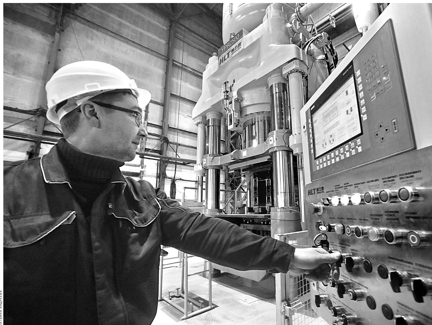
В Богдановиче на предприятии, производящем огнеупоры, запущен новый пресс. Агрегат высотой с четырехэтажный дом позволит предприятию освоить выпуск крупнотоннажных изделий, используемых в черной, цветной металлургии, стекольной промышленности. Инвестиции в проект превысили 100 миллионов рублей, создано 15 новых рабочих мест.

Отличие этой модели от серийного полувагона заключается в инновационной тележке с повышенной осевой нагрузкой, увеличивающей грузоподъемность, межремонтный пробег и объем кузова. Преимущества такого полувагона обуславливают и более высокую цену, поэтому сейчас спрос на обе модели распределяется в соотношении 50 на 50. Производственные планы предприятия на 2019 год примерно такие же, как и на текущий. ●