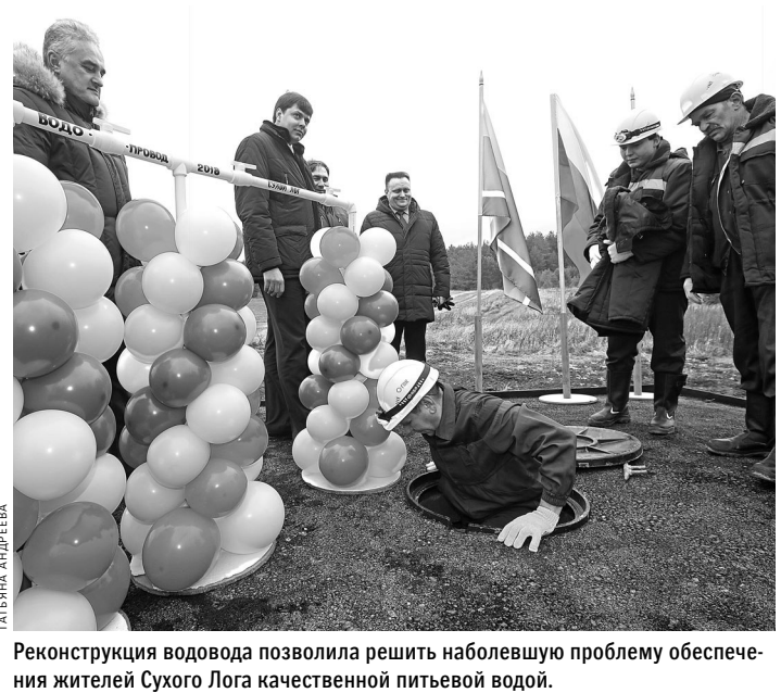
Реконструкция водовода позволила решить наболевшую проблему обеспечения жителей Сухого Лога качественной питьевой водой.

Кстати, в отношении директора ОГТ ранее уже было возбуждено административное дело по статье о невыплате заработной платы. ●