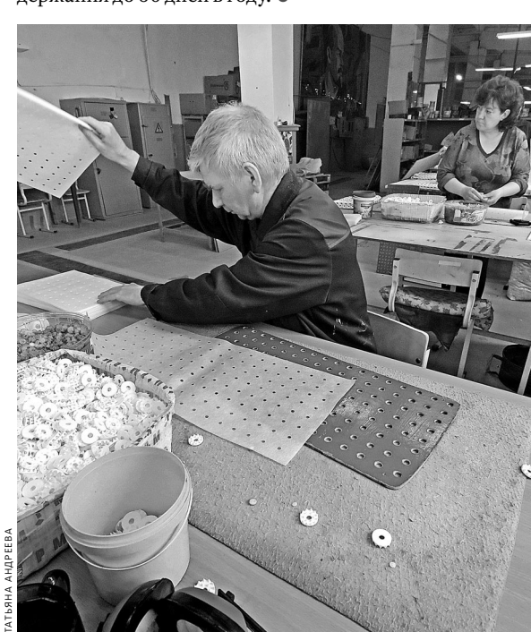
Большее всего инвалидов трудятся на предприятиях Всероссийского общества слепых.