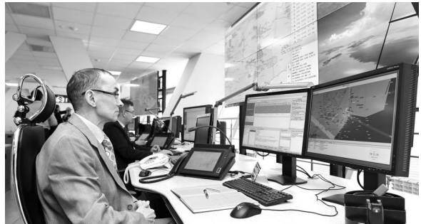
Диспетчеры разместились в новом здании, оснащённом современной цифровой техникой.

В аэропорту Кольцово открыли новый центр Единой системы воздушного движения, который будет контролировать авиатранспорт шести субъектов РФ: Республики Удмуртия, Кировской, Курганской, Свердловской, Челябинской областей и Пермского края. Здание возвели в рекордный срок — менее двух лет. Объем инвестиций в проект составил 1,5 миллиарда рублей. Это собственные средства корпорации по организации воздушного движения — бюджетные деньги не привлекались.