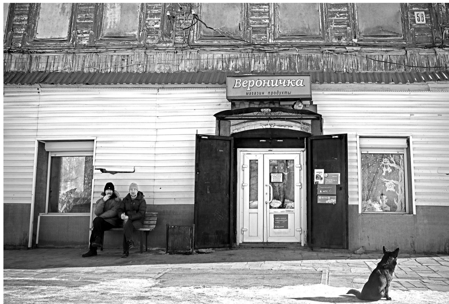
Кооператоры и ИП, которые держат магазинчики в селе, опасаются, что под натиском сетей им не устоять.

появится, ему надо успеть отсканировать акцизную марку. Мы вынуждены закрывать магазины, например, в двух самых крупных селах.