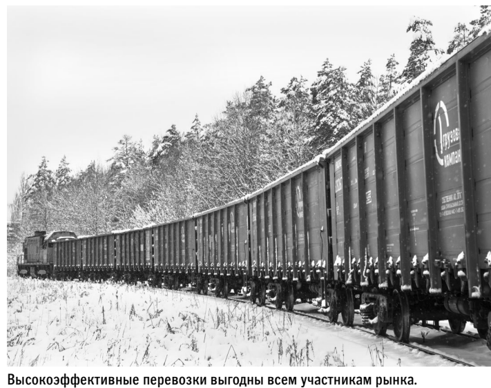
Высокоэффективные перевозки выгодны всем участникам рынка.

—Решая насущные вопросы, мы одновременно выполняем важнейшую государственную задачу профориентации молодежи. Создаем для студентов модель производственного процесса и даем им возможность в него окунуться, узнать работу предприятия изнутри. Неважно, где эти ребята будут трудиться потом, у них останется понимание того, как должно быть организованно производство на самом высоком уровне. Мы стараемся им это показать и, в свою очередь, получаем возможность пригласить к наиболее способным и талантливым, чтобы предложить им связать свою судьбу с «Маяком».