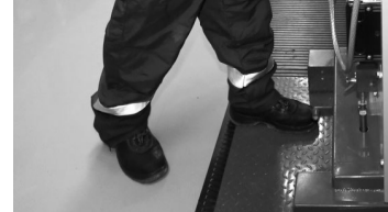
Экономия ресурсов в компании достигается за счет настройки оптимального технологического режима работы оборудования и автоматизации.

В 2018 году комплексным благоустройством занимались в 41 муниципальном образовании Среднего Урала, было реконструировано 102 двора и 38 общественных пространств.