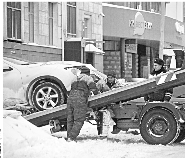
Опасные для машин эвакуаторы с лебедкой сегодня составляют 70 процентов от общего количества такой техники.