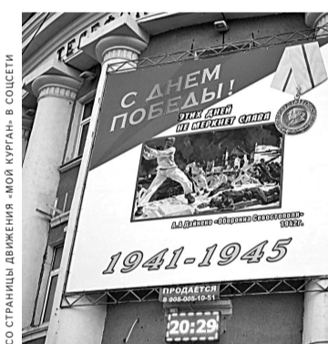
Ошибки на пятиметровых баннерах в центре Кургана едва не испортили курганцам праздник.

Потери агентства не только репутационные — переделка обошлась в такую же сумму, которую компания потратила первоначально