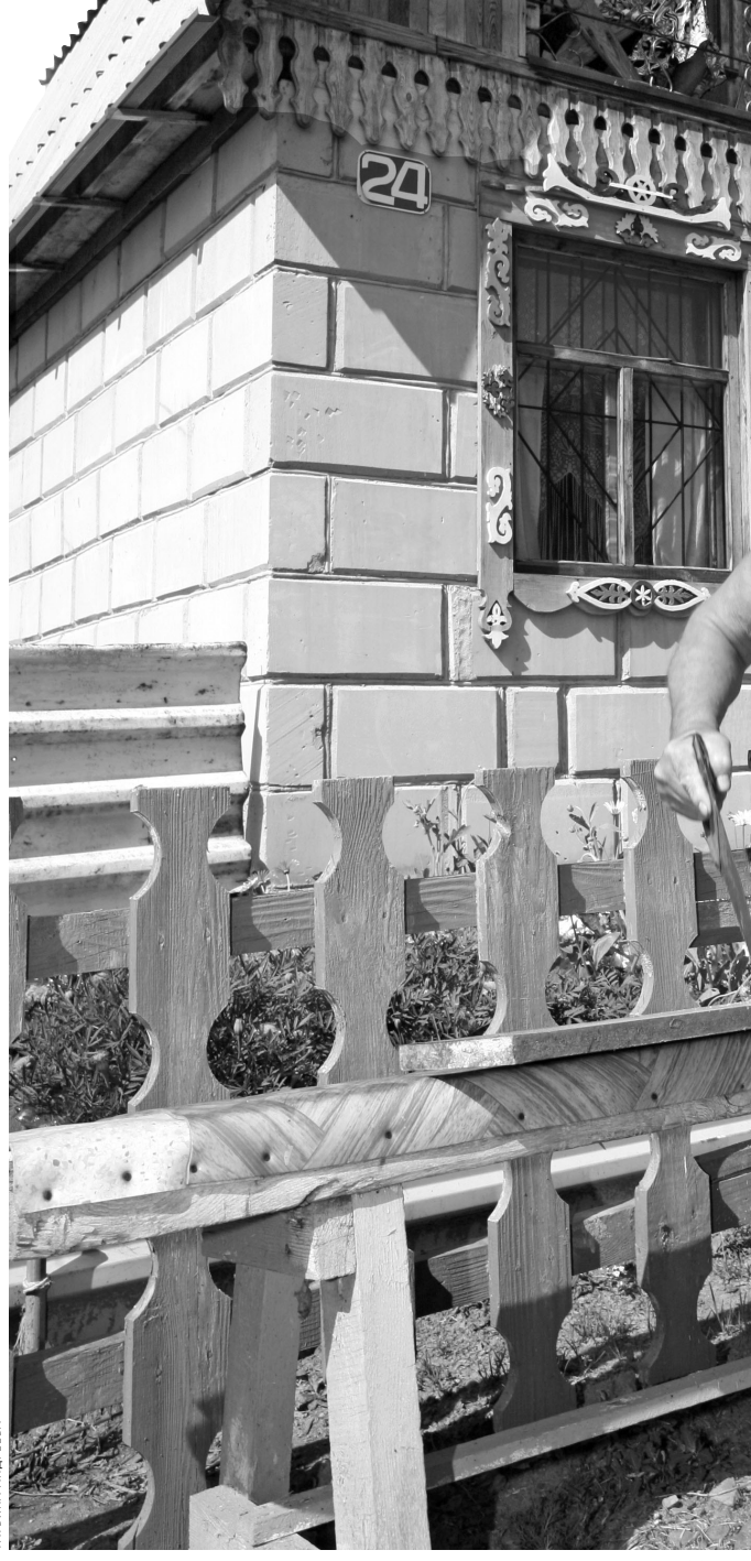
Для пенсионеров дача — и источник дешевых овощей, и фитнес, и хобби.

По понятным причинам за скобками исследования остался ЯНАО: в краю вечной мерзлоты садоводством заниматься не станешь. В Югре, которая чуть южнее, мужественные огородники встречаются, но спрос на дачи здесь заметно упал, как и цена.