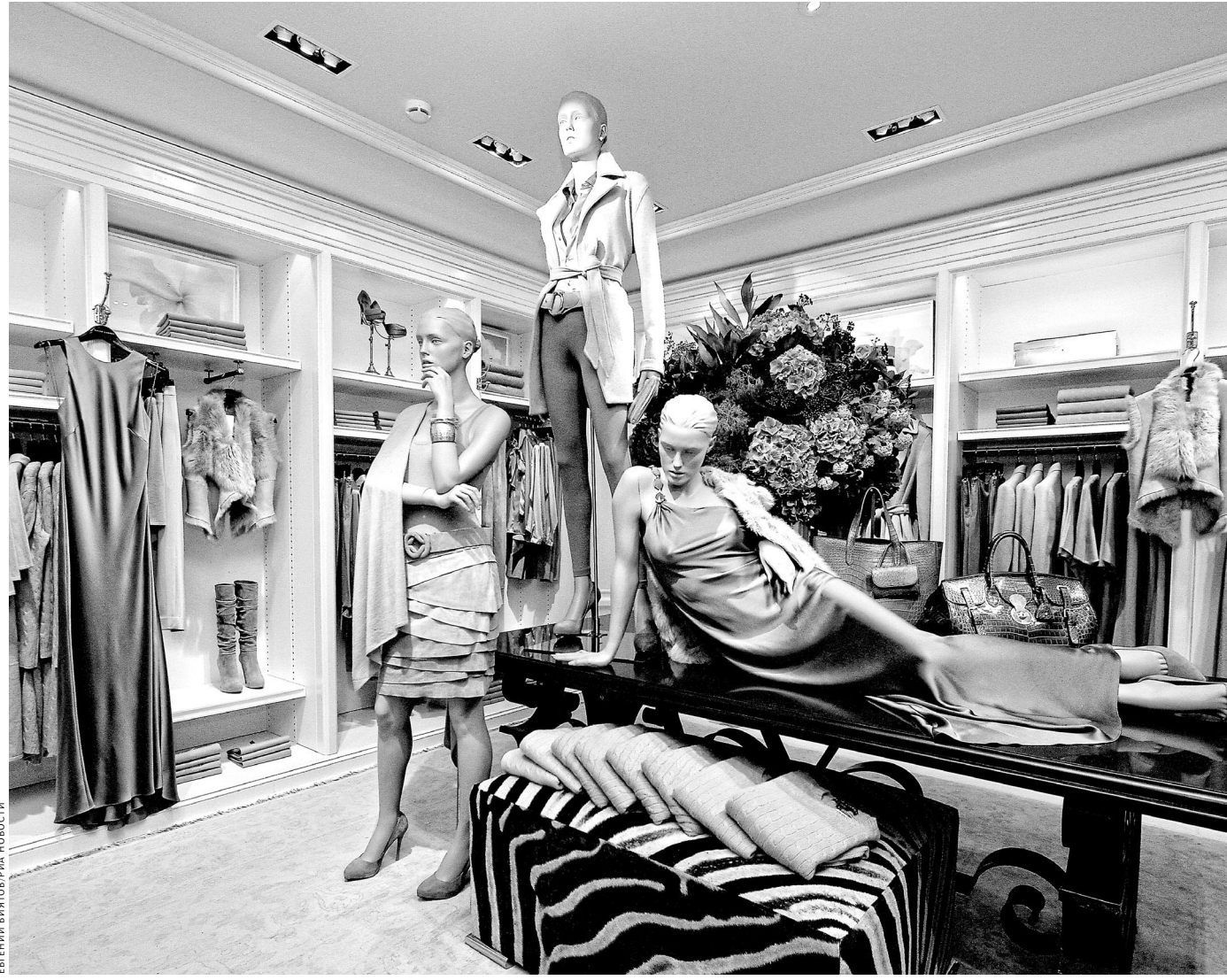
В екатеринбургском ТЦ, несмотря на резонанс, который произвела проверка, не то что предполагалось, но и сам факт комментариев не хотят.

Среди любителей одежды мировых брендов тут же поползли слухи, что под крышей уральских элитных бутиков продавался банальный контрафакт, произведенный не в Италии и Франции, а где-нибудь в подвале.