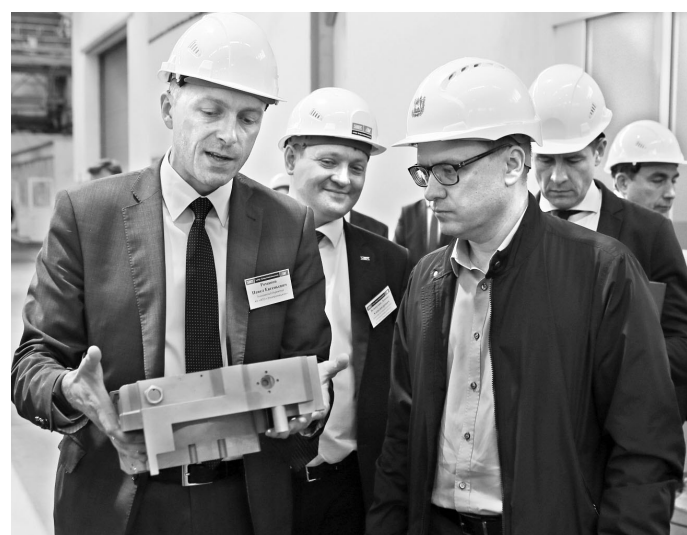
Алексей Текслер (справа), посетил НПО «Электромашина», отметил, что именно на такие современные предприятия следует ориентироваться всей промышленности региона.

Очередная апелляционная инстанция подтвердила решение Арбитражного суда Челябинской области о привлечении местного маслодельного заводика к административной ответственности за поставку в детсады, больницу и дом-интернат поддельного сливочного масла. А в одном из магазинов Амурской области выявлена 300-килограммовая партия фальшивки, поступившая из Свердловской области от некоего ИП. Ранее его же товар был признан не соответствующим стандартам молочной продукции экспертами Оренбургской и Саратовской областей.