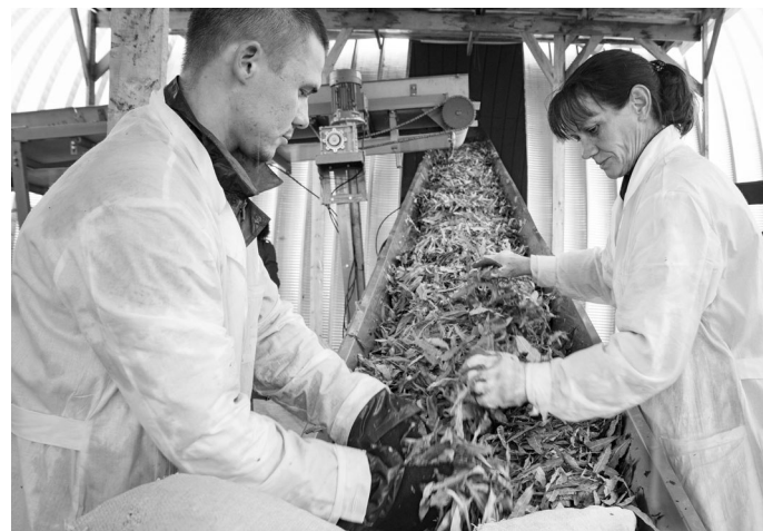
Большинство работающих в цехе — жители окрестных деревень.