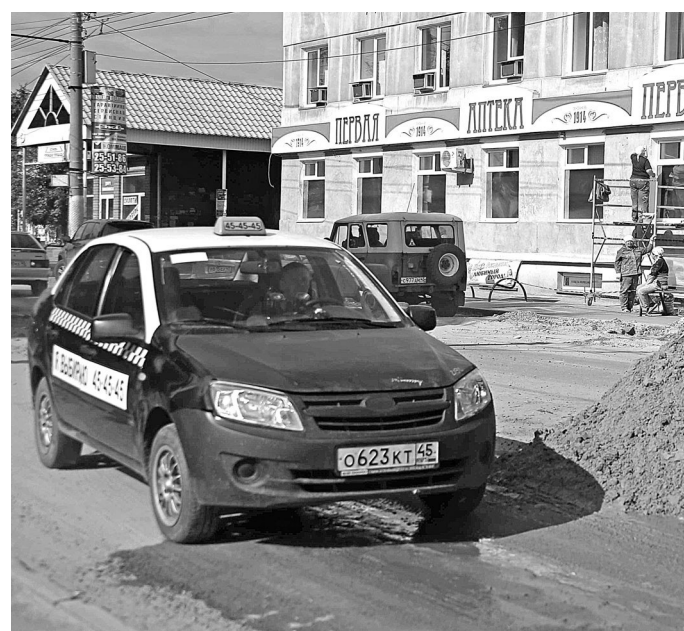
Агрегаторы заинтересованы в сотрудничестве с легальными водителями, которые ездят на машинах с «ашечками» и отвечают за безопасность пассажиров.

Многие уходят в тень вынужденно, поскольку нет простого, понятного и справедливого механизма легальной работы