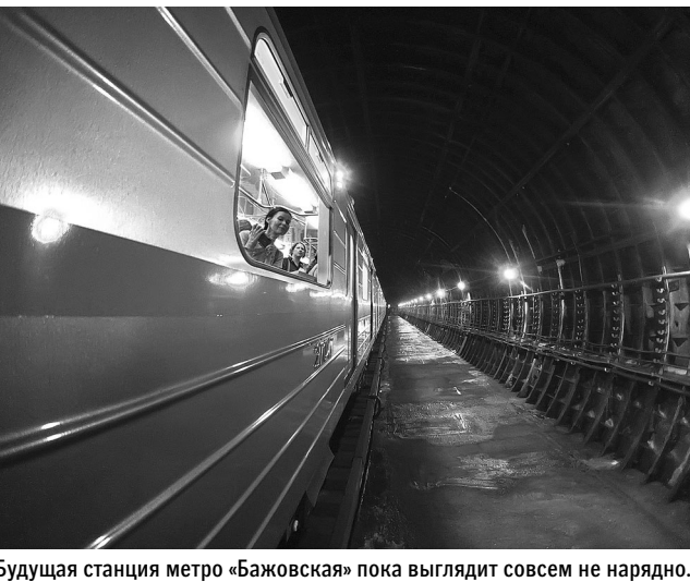
будущая станция метро «Бажовская» пока выглядит совсем не радяно.

Екатеринбуржцам нравится идея фуникулера, однако они напимуют о проектах, презентованных мэрией давным-давно, но так и не реализованных. Например, о ветке скоростного трамвая в Академический: за 12 лет обещаний он так и не появился. ●