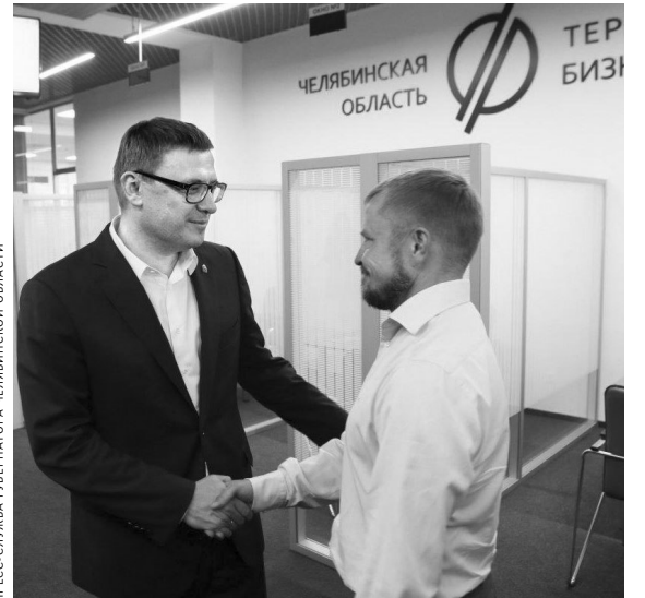
Алексей Текслер и Александр Калинин (справа) достигли взаимопонимания в вопросах поддержки бизнеса.

—Мы уже выдали предпринимателям региона гарантийный и поручительств в рамках Национальной системы на 7,2 миллиарда рублей, что позволило малым и средним компаниям привлечь 15,9 миллиарда рублей кредитных средств для реализации проектов в приоритетных отраслях экономики, — сообщил Александр Браверман. — Представленные сегодня инвестпроекты, без сомнения, интересны, и им будет оказана поддержка. Уверен, в дальнейшем их число будет расти. ●