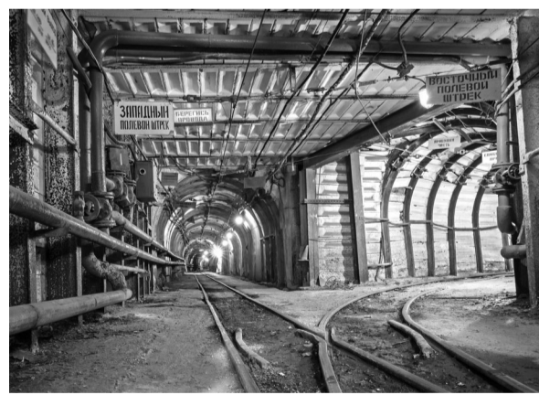
Уральское предприятие, добывающее изумруды, много лет было на грани выживания, пока его не передали госкорпорации.