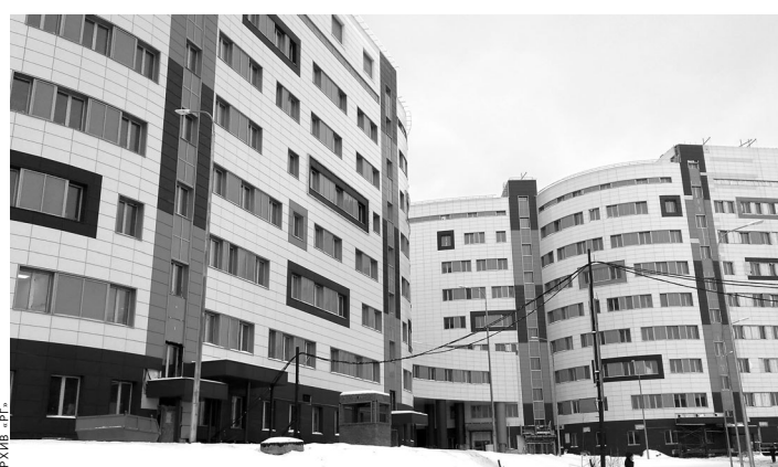
Для оснащения огромного девятиэтажного центра приобретено 18 тысяч единиц медоборудования.

Сверхдоходы в здравоохранении невозможны, тем более когда предусмотрена обязанность оказывать услуги по системе обязательного медстрахования