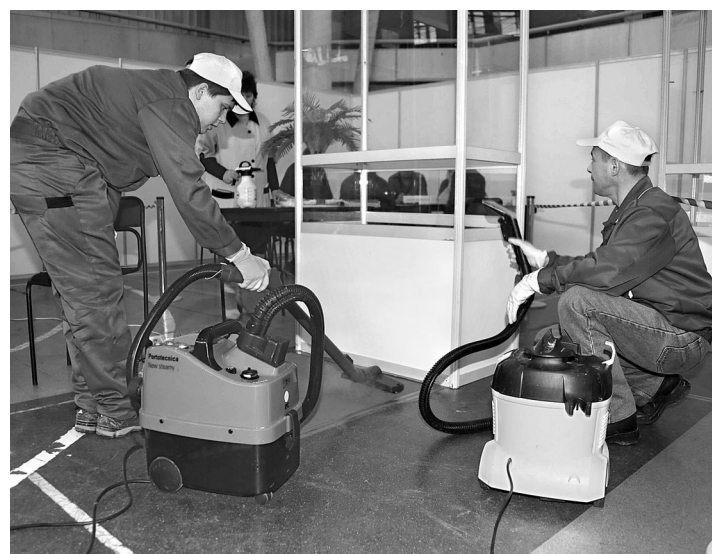
Основная статья расходов клининговых компаний — оплата труда. Однако и техника для профессиональной уборки стоит дешево.