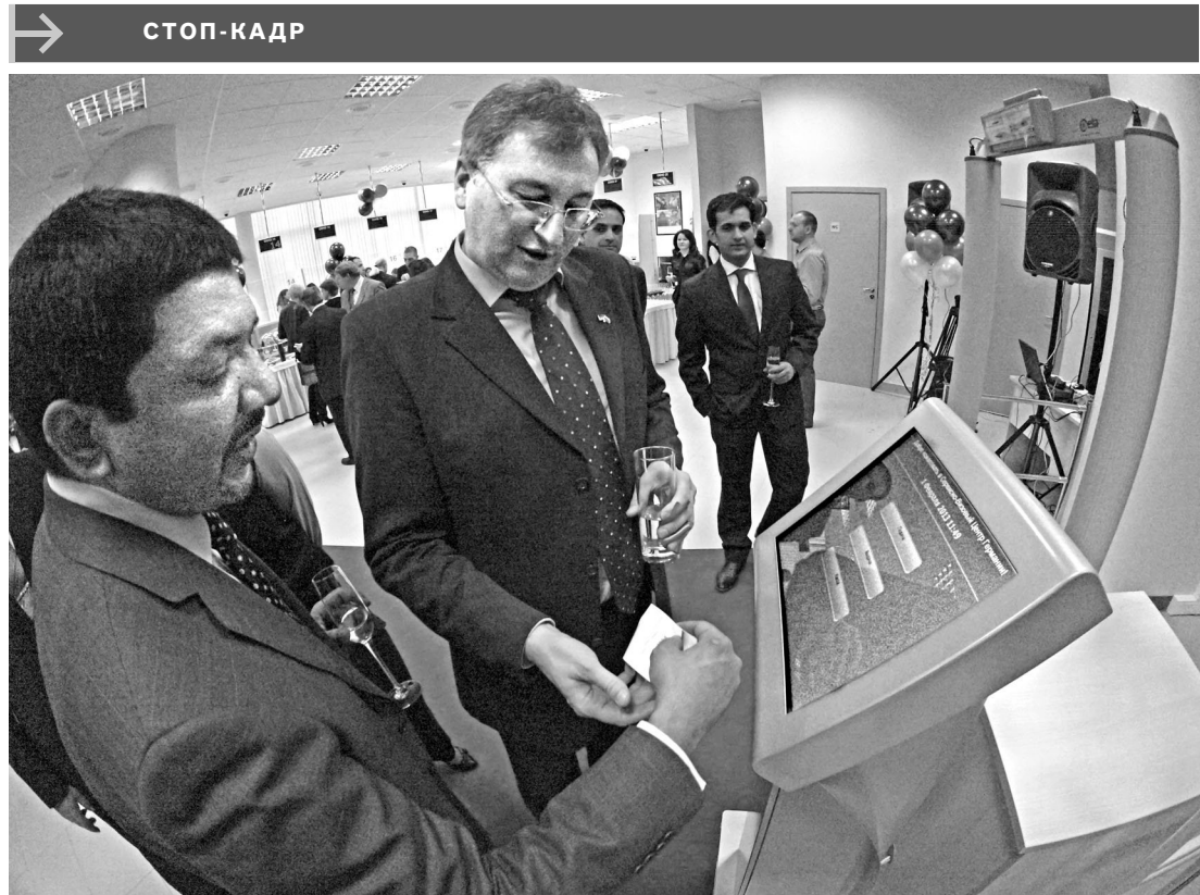
В Екатеринбурге открылся визовый центр Германии. Он будет принимать заявления от граждан России, Белоруссии, Украины и Казахстана на выдачу шенгенских виз для краткосрочных поездок в течение полугода. Это второй по счету визовый центр ФРГ в России. Авторы проекта надеются, что его появление позволит упростить оформление виз, ликвидировать очереди в визовых отделах консульств.

тарными требованиями. Это обошлось городу в четыре раза дешевле, чем строительство нового.