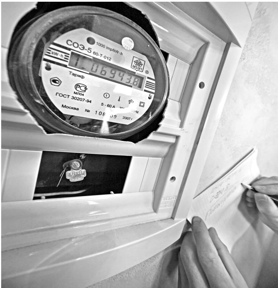
Обязательное условие участия в программе — оборудование всех квартир дома индивидуальными приборами учета энергоресурсов.

Так, одним из главных условий участия МКД в региональной программе станет увеличение минимальной доли собственников жилых помещений в общей стоимости капремонта с 5 до 15 процентов. Арифметика такая: 64 процента стоимости берут на себя областной и муниципальный бюджеты,