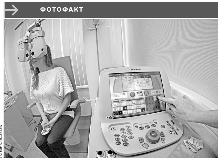
В Верхней Пышме Свердловской области начал работать крупный офтальмологический центр. Благодаря инициативе бизнеса и участию региональных властей жители Верхней Пышмы и Среднеуральска смогут воспользоваться услугами высококлассных офтальмологов недалеко от дома и абсолютно бесплатно. В детском отделении центра откроется «Школа зрения» — уникальная программа, разработанная для лечения детской глазной патологии: все процедуры здесь будут проходить в форме игры.