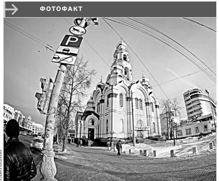
В Екатеринбурге в Максимилиановском храме, восстановленном спустя 83 года после уничтожения, прошла первая литургия. «Большой Златоуст» (народное название) — единственный в Екатеринбурге храм-колокольня. Его основной колокол — точная копия своего предшественника — самый крупный на Урале: вес — 16 тонн, диаметр — 2,7 метра, высота — около 3 метров.

Окружная клиническая больница Ханты-Мансийска: Тел.: (3467) 39-00-02, 32-05-97.