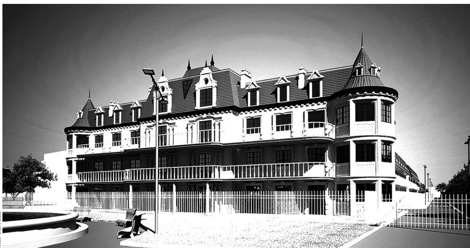
Комплекс таунхаусов соответствует высоким требованиям европейских стандартов.

Сегодня приобрести жилье рядом с морем, где можно было бы с комфортом жить, не чувствуя себя стесненно, – уже непросто. А теперь представьте себе, что вы поселились почти на территории санатория, в 250 метрах от набережной, в фешенебельной зоне Анапы. Именно здесь расположился жилой комплекс таунхаусов бизнес- и эко-