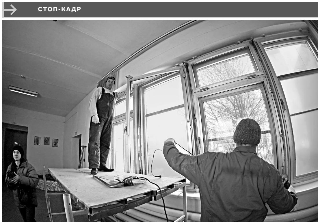
На Южном Урале идет восстановление жилых и социальных объектов, пострадавших от метеоритного дождя, обрушившегося на регион 15 февраля. Руководство области озвучило срок окончания работ по остеклению социальных учреждений — 25 февраля.