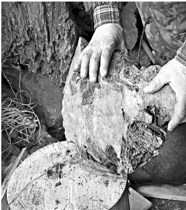
Годичные кольца деревьев помогают ученым восстановить историю лесов.

Но, как оказалось, эксперименты с кольцами полицейским не в новинку. Хотя специалистов в данной области в нашей стране всего около сотни, старейшая и одна из ведущих лабораторий дендрохронологии базируется в