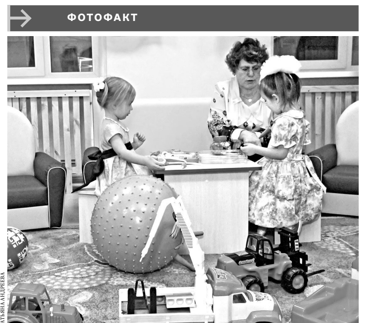
В Красноуфимске Свердловской области открылось новое здание детского сада № 18. Теперь в дошкольном учреждении есть все необходимое для ухода и обучения малышей. Впервые в городе помещения детского сада оборудованы системой видеонаблюдения.

Приемная Генпрокуратуры РФ в УрФО: г. Екатеринбург, ул. Пушкина, 3, ежедневно с 9.00 до 18.00. Интернет-приемная www.genprok-urfo.ru