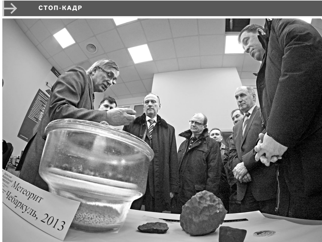
Секретарь Совета безопасности РФ Николай Патрушев провел закрытое совещание с губернаторами УрФО, посвященное обсуждению мер по борьбе с незаконным оборотом наркотиков и нелегальной миграцией. Одним из пунктов программы визита стало посещение Уральского федерального университета, где секретарю Совбеза (в центре слева) продемонстрировали самый большой из найденных на Южном Урале обломков метеорита — весом 1,8 килограмма.