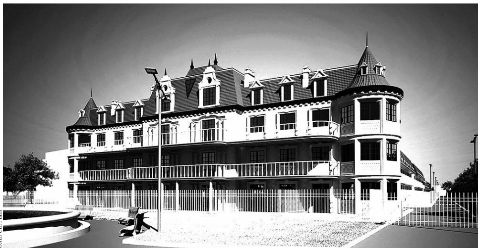
Комплекс таунхаусов соответствует высоким требованиям европейских стандартов.

Сегодня приобрести жилье рядом с морем, где можно было бы с комфортом жить, не чувствуя себя стесненно, — уже непросто. А теперь представьте себе, что вы поселились почти на территории санатория, в 250 метрах от набережной, в фешенебельной зоне Анапы. Именно здесь расположился жилой комплекс таунхаусов бизнес- и эко-