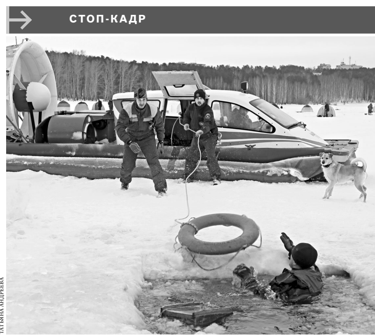
Рейд по профилактике несчастных случаев на тонком весеннем льду провели сотрудники ГУ МЧС России по Свердловской области совместно с полицией. Спасатели провели практическое занятие, где продемонстрировали рыбакам различные способы самоспасения и показали алгоритм действий по оказанию помощи провалившемуся под лед.