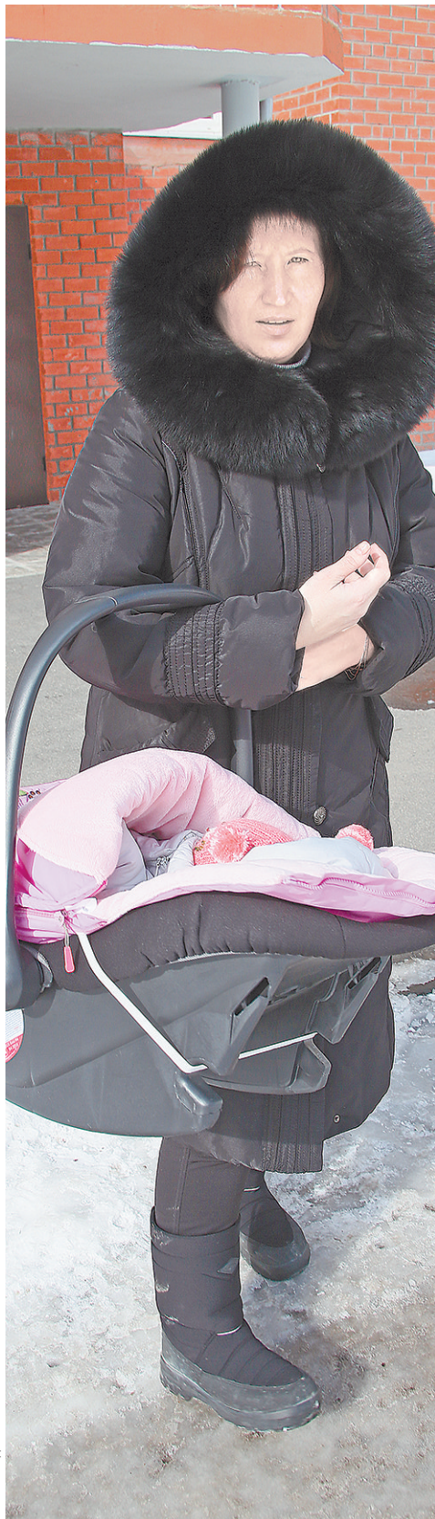
Автомобильная люлька для перевозки младенцев более устойчива и безопасна, чем переноска.