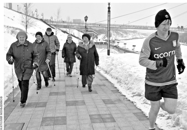
Скандинавской ходьбой пока увлекаются те, кому за сорок.