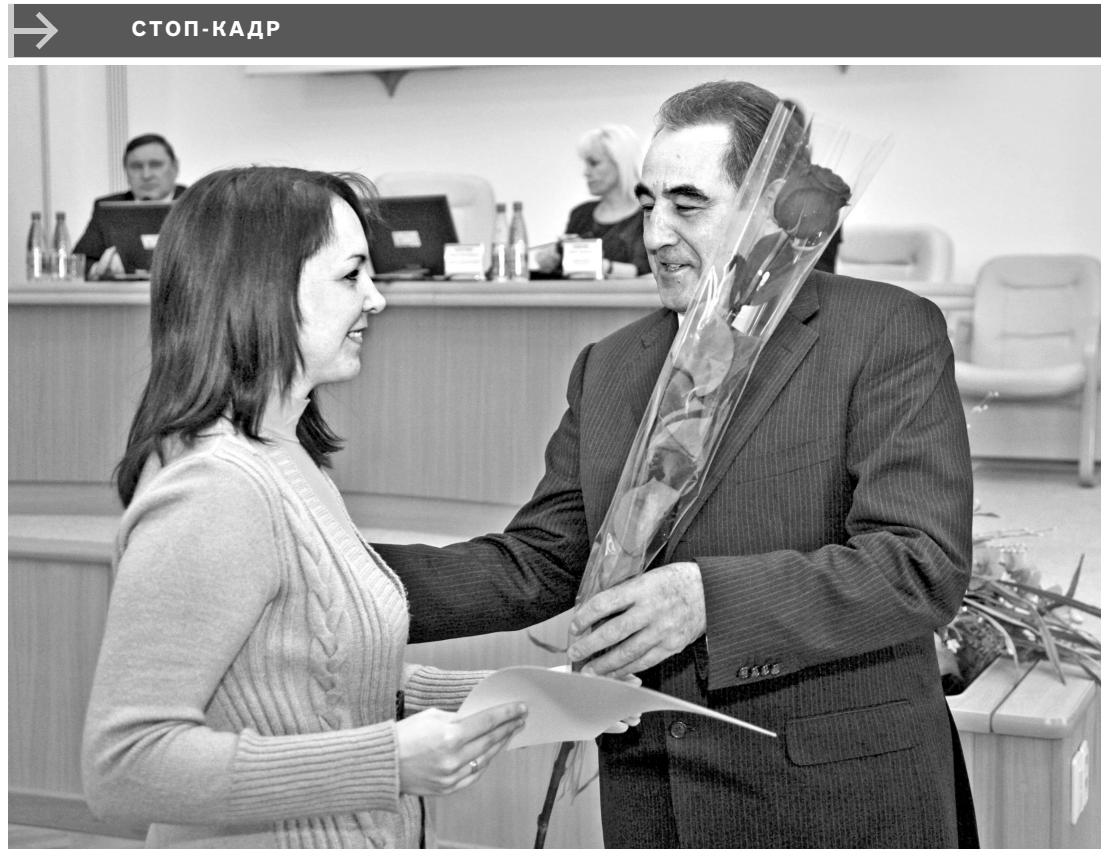
В Курганской области прошла первая в этом году церемония вручения регионального материнского капитала. Сертификаты о предоставлении субсидий на погашение ипотечного кредита на сумму около 314 тысяч рублей вручили 177 молодым семьям. Ожидается, что в 2013 году региональный маткапитал получат около 700 семей.