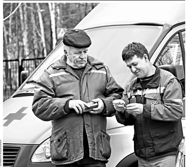
Верхнепышминской станции скорой медицинской помощи передали ключи от пяти современных спецавтомобилей, приобретенных на средства Уральской горно-металлургической компании. Благодаря новейшему оборудованию ГАЗелей медики смогут оперативно доставлять пациентов не только в местную больницу, но и в лечебные учреждения Екатеринбурга, особенно больных с резким обострением сердечно-сосудистых заболеваний или с тяжелыми травмами.