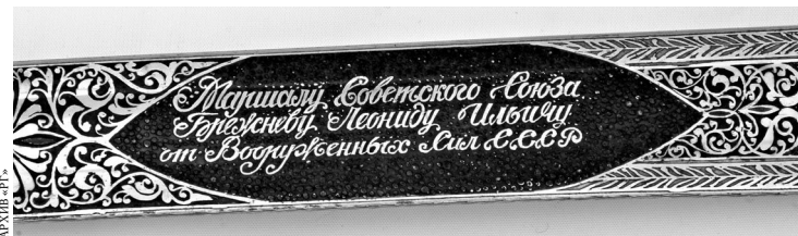
Среди пропавших экспонатов — именная сабля Леонида Брежнева.