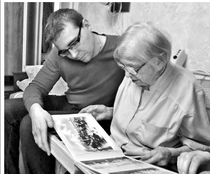
Главное для ветеранов — живое общение.

— Сегодня мы чествуем наших дорогих и любимых ветеранов. Для партии «Родина» очень важна забота о старшем поколении. Мы готовы сделать все, чтобы деды и прадеды гордились нами, — рассказал член Свердловского регионального отдела-