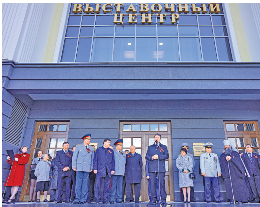
Открытию выставочного центра участвовали первые лица Свердловской области.