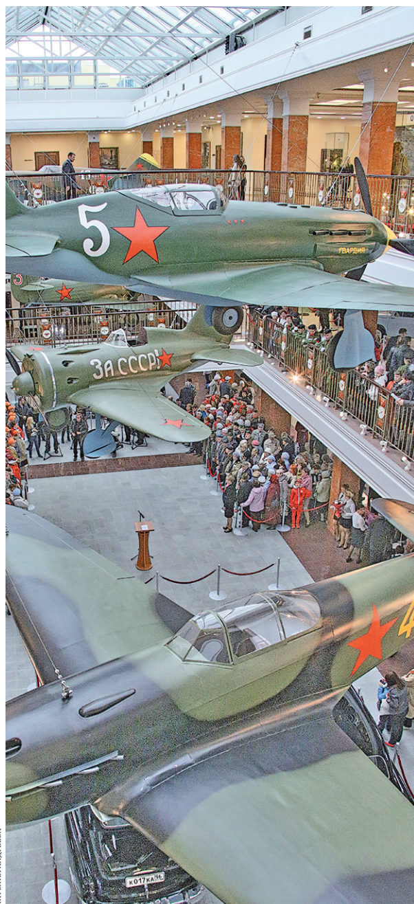
Макеты боевых самолетов-легенд как бы парят в воздухе.

переданная Советской Армии по ленд-лизу. 70–80 процентов машин до сих пор на ходу благодаря стараниям мастеров цеха реставрации и ремонта УГМК. Чтобы максимально точно восстановить технику, найденную поисковиками на местах бывших сражений, эксперты ездят в архивы, поднимают чертежи.