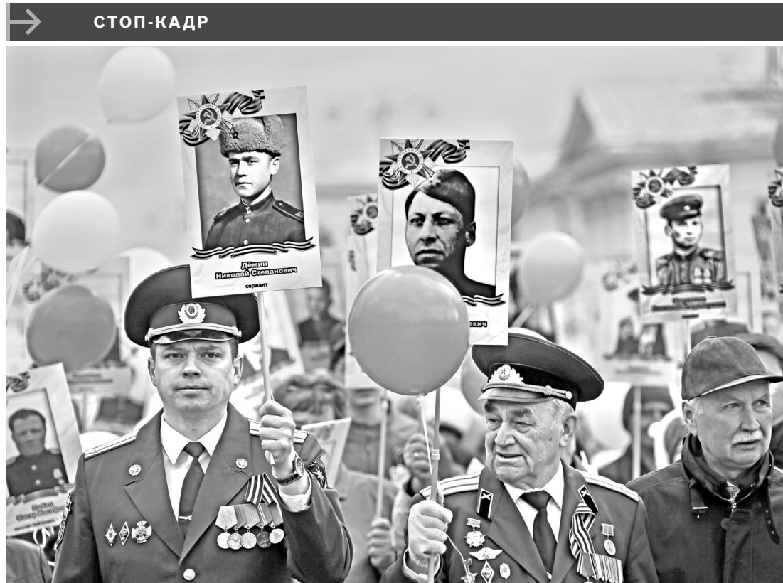
В Екатеринбурге впервые 9 Мая прошло шествие Бессмертного полка. Четыре тысячи свердловчан пронесли по главной площади города портреты своих родных и близких — участников Великой Отечественной войны.