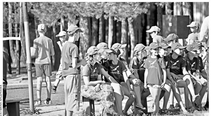
Отдых в сосновом бору на свежем воздухе надолго запомнится детям.