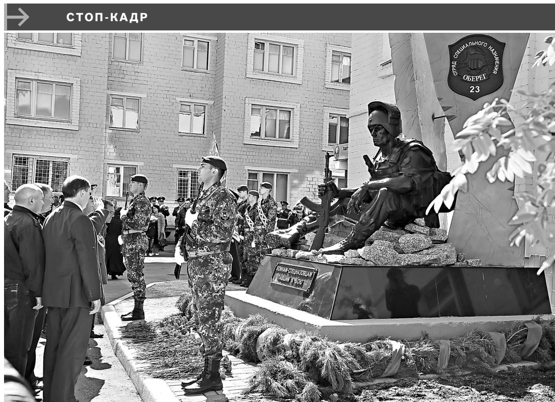
В Челябинске открыли памятник российским военнослужащим, погибшим на Северном Кавказе. Скульптурная композиция установлена на территории расположения отряда специального назначения «Оберег», который в эти дни семь лет назад в столкновении с бандформированиями понес большие потери: четверо бойцов погибли, еще несколько были ранены. Всего с 2003-го по 2012 год в служебных командировках на Северном Кавказе, выполняя воинский долг, погибли 12 военнослужащих отряда.