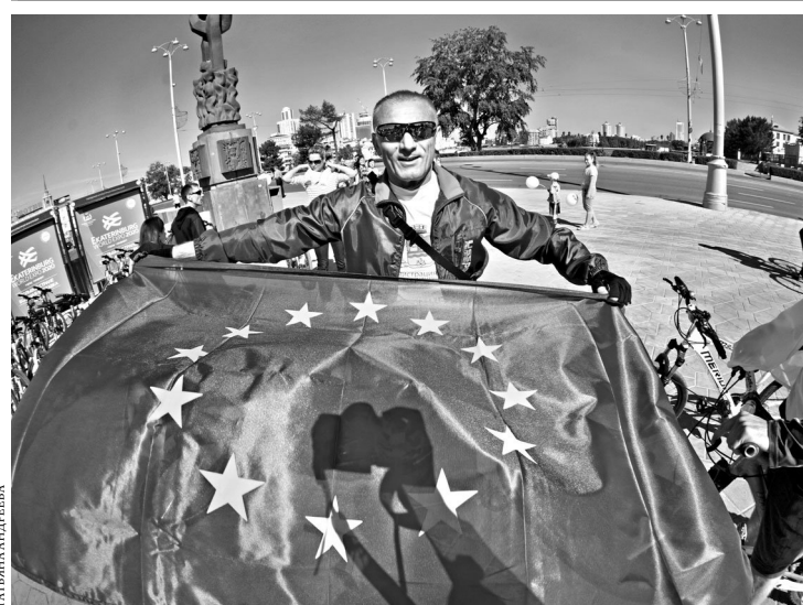
В Екатеринбурге накануне саммита Россия — ЕС прошли «Дни Европы». Почетными гостями праздника в Центральном парке культуры и отдыха имени Маяковского стали дипломаты и представители Евросоюза. На Европейской ярмарке страны ЕС представили свои павильоны, а также отправили всех желающих в видеопутешествия по городам Старого Света. Кроме того, любознательные екатеринбуржцы смогли присутствовать на открытых уроках европейских языков и отведать блюда чешской, немецкой, баварской, австрийской и итальянской кухонь.