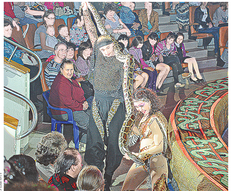
Зрители новой цирковой программы общались с питоном.