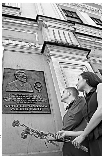
Из тылового Свердловска Юрий Левитан передавал сводки Совинформбюро.

Подсчитано, что за годы войны Юрий Левитан озвучил око-