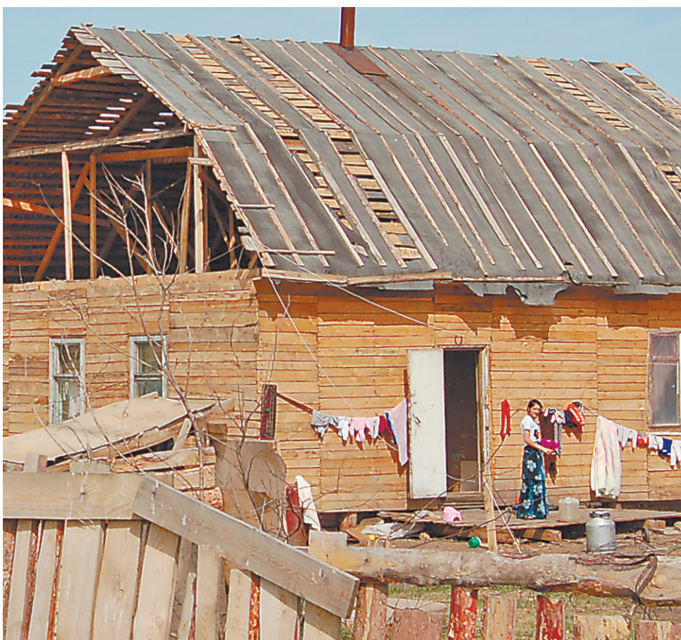
Цыгане, как смогли, устроили свой быт в поселке.

По плану зонирования земля, где живут цыгане, предназначена для индивидуальной застройки. Цыганское поселение оформлено как дачный кооператив, но организация садоводческих товариществ в этом месте не предусмотрена. По итогам слушаний в Курганской гордуме зону малоэтажной застройки планируется перевести в зону застройки «объектами сезонного проживания», то есть отдать землю под садовое товарищество и узаконить пребывание табора в Затобольном.