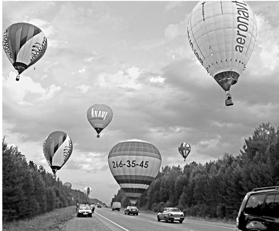
Более двадцати аэростатов-участников XII Международного фестиваля воздухоплателей «Небесная ярмарка» поднялись в небо над Средним Уралом, чтобы пересечь границу между Европой и Азией под Первоуральском. Организаторы надеются, что эта акция войдет в Книгу рекордов Гиннесса, так как еще никогда воздушные границы, пусть и символические, не пересекались так массово и смело.