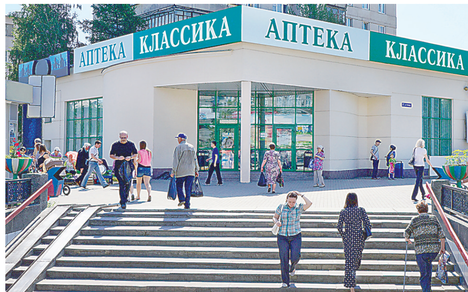
Вслед за уральцами москвичи смогут оценить качество обслуживания в аптеках «Классика».