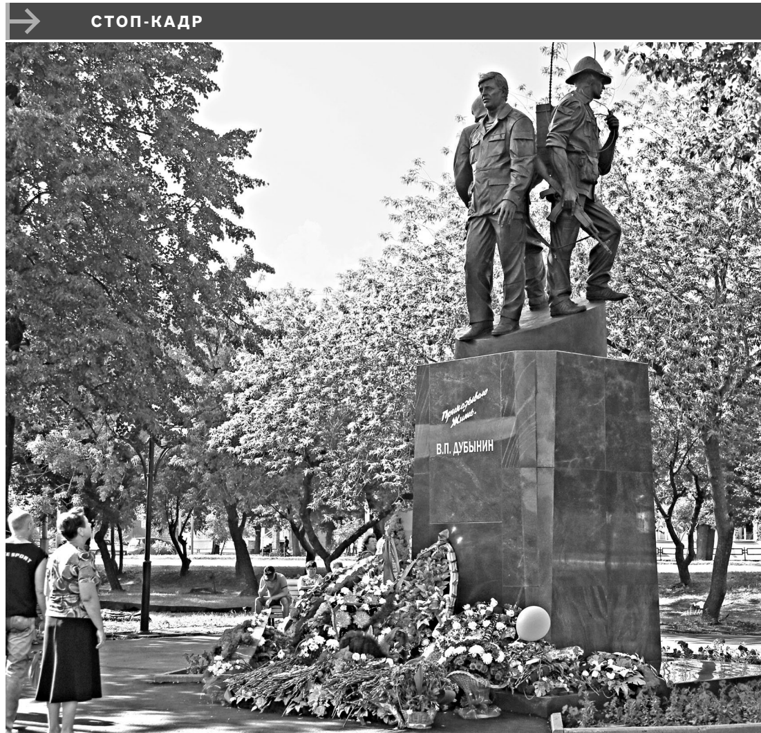
В Каменске-Уральском, на родине Героя России, в торжественной обстановке открыли памятник генералу армии Виктору Дубынину и всем солдатам и офицерам, участникам боевых действий и контртеррористических операций. «Генерал армии Виктор Дубынин — это честь и совесть нашей армии. Память о нем дает надежду, что Россия вновь обретет державное достоинство и силу, иначе она бы не рождала таких сыновей», — цитировали собравшиеся строчки из книги очерков «Герои России Уральского федерального округа».