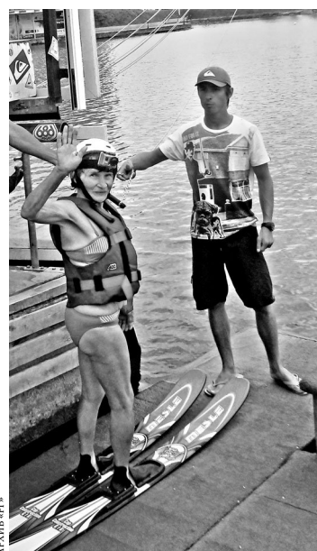
Семидесятилетние экстремалки не боялись промчатся по волнам.

Вейкбординг — это комбинация водных лыж, сноуборда, скейта и серфинга. Не каждый молодой рискнет промчатся на скейте по волнам, а семидесятилетние бабушки из Екатеринбурга убедили и медработников, и сотрудников социальных служб, что это им по силам. Инструкторы бабушек все-таки поберегли: скорость движения снизили вдвое. Но все равно бабушки не однажды нырнули в воду, и каждая хоть раз, но сделала круг на водном скейте. А бурю эмоций пожилые женщины испытали благодаря Центру соцобслуживания Кировского района.