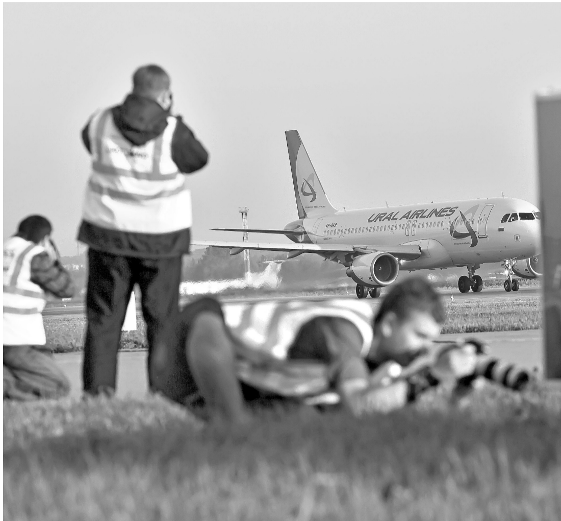
В аэропорту Екатеринбурга прошла акция в честь 70-летия гражданской авиации на Урале. Для сотни фотографов со всей страны были организованы самые привлекательные точки съемки: с рулежных дорожек рядом с взлетно-посадочной полосой, с крыш близлежащих зданий. Каждый день на рассвете и при любой погоде папарацци могли сделать интересные снимки взлета и посадки самолетов, процесса обслуживания воздушных судов.