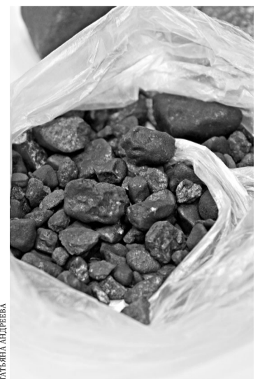
Осколки челябинского метеорита смонтируют в награды олимпийцам.