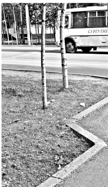
За пять дней эксперимента сургутяне загрязнили город меньше, чем это делалось раньше за сутки.

Некоторые выводы для себя коммунальщики уже сделали. Наиболее замусоренными за эти дни оказались перекрестки и пешеходные переходы, потому чиновники намерены впредь обратить на них особое внимание. При