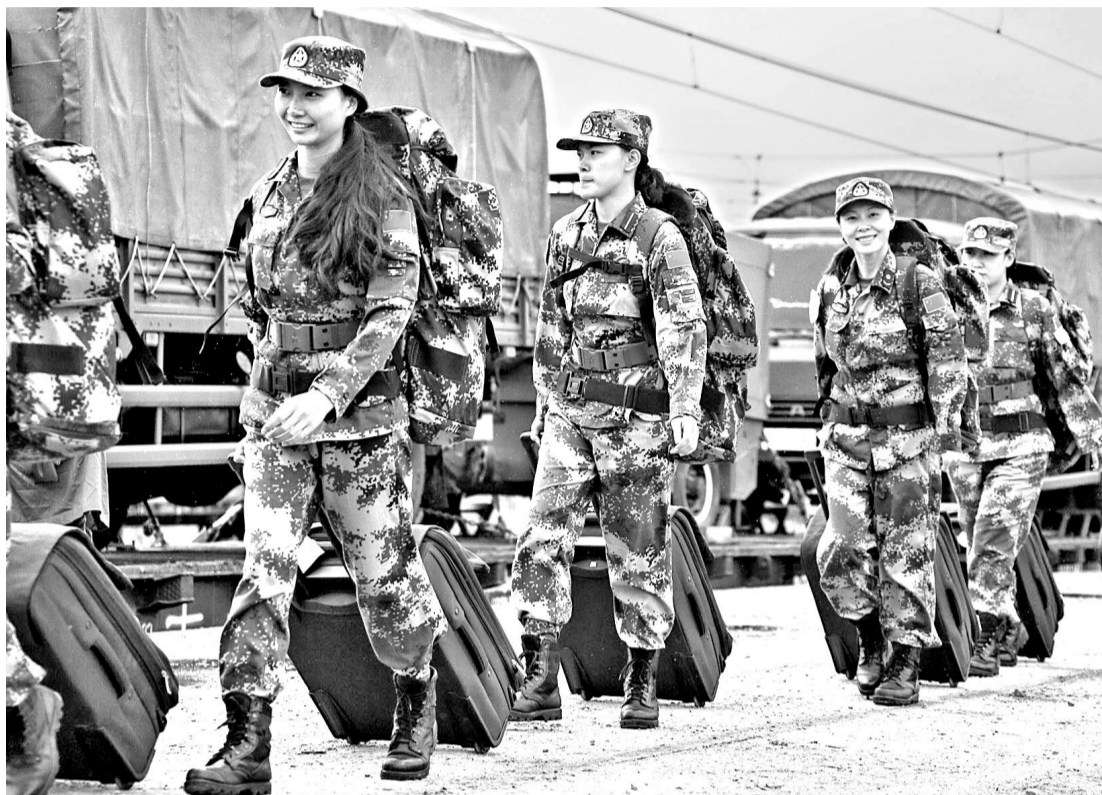
На Чебаркульском полигоне начались российско-китайские антитеррористические учения «Мирная миссия-2013». На Южный Урал прибыли около 1,5 тысячи военнослужащих и 250 единиц военной техники обеих стран. Целью «Миссии» станет отработка методов и форм совместной работы по подготовке и ведению боевых действий в ходе антитеррористической операции. Китайские товарищи приехали в Россию и с культурной миссией: творческая группа художественного ансамбля Народно-освободительной армии Китая выступит на полигоне и даст концерты в Челябинске и Екатеринбурге.