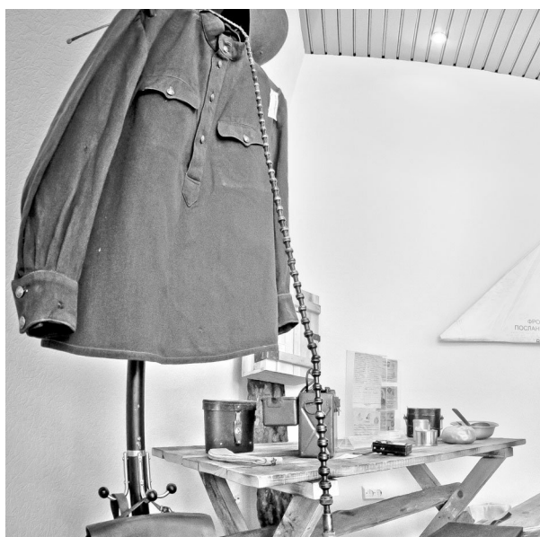
В музее представлены атрибуты почтовой службы времен Великой Отечественной войны.