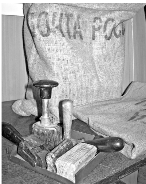
Сургучница с настоящим сургучом — экспонат из прошлого: теперь ее можно найти только в музее.