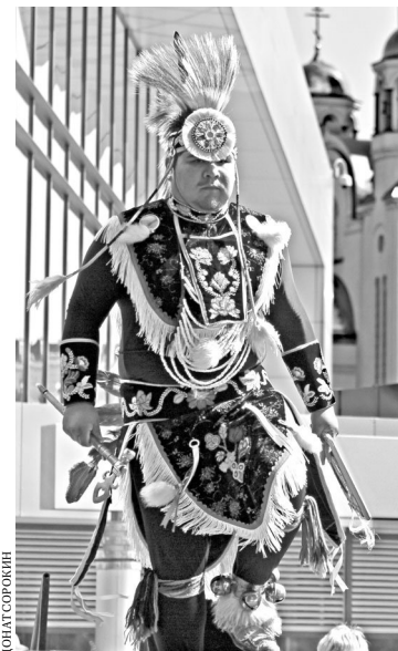
Каждый индейский костюм отражает уникальную символику семьи, клана, общины.