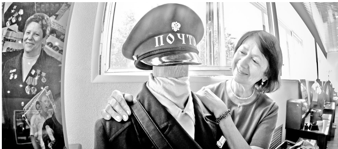
В синей форменной фуражке.