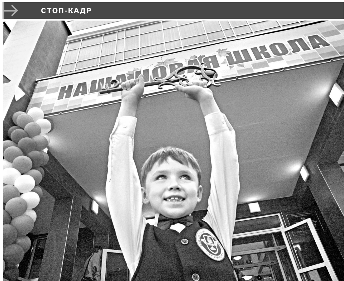
В новом быстроразвивающемся екатеринбургском районе Академический открылась школа, уже вторая по счету. Она стала одним из самых просторных общеобразовательных заведений Свердловской области—площадь здания превышает 16 тысяч квадратных метров. В школе 52 предметных кабинета, лекционный и компьютерные классы и даже фотостудия. Важно, что для детей с ограниченными возможностями здоровья здесь оборудованы специальные лифты.