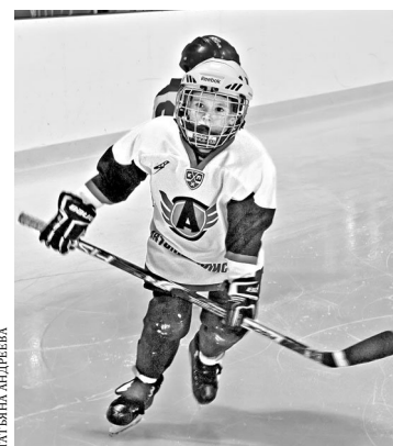
Появление новой ледовой арены позволит екатеринбургской хоккейной школе воспитать больше игроков, способных претендовать на ведущие места во всероссийских турнирах.

—Львиную долю—291 миллион—в этот проект вложил бюджет