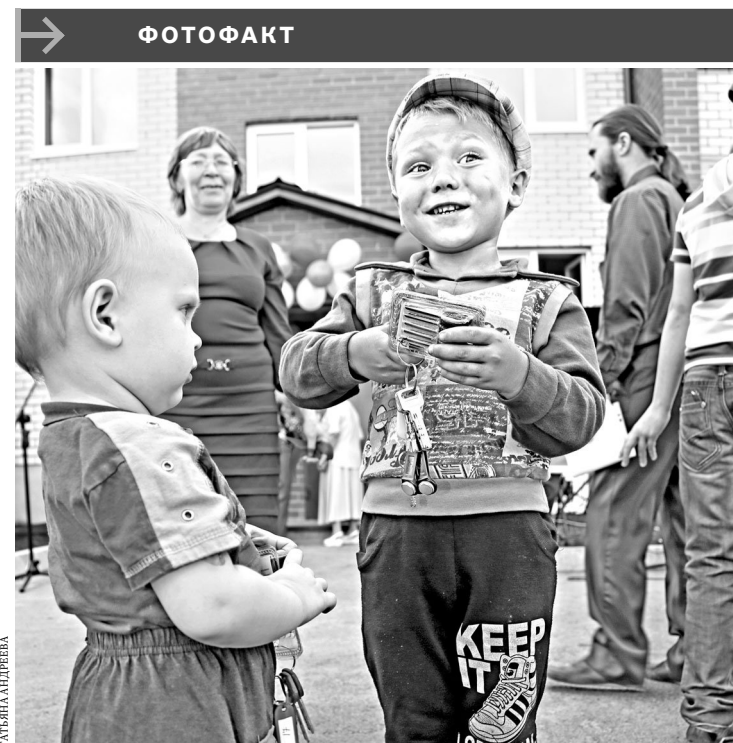
На Среднем Урале новоселье справили жители поселка Тугулым. Жилье в новом 24-квартирном доме поровну распределили между детьми-сиротами, ранее не имевшими своего угла, и обитателями ветхих и аварийных домов.

Светлана Добрынина, Свердловская область