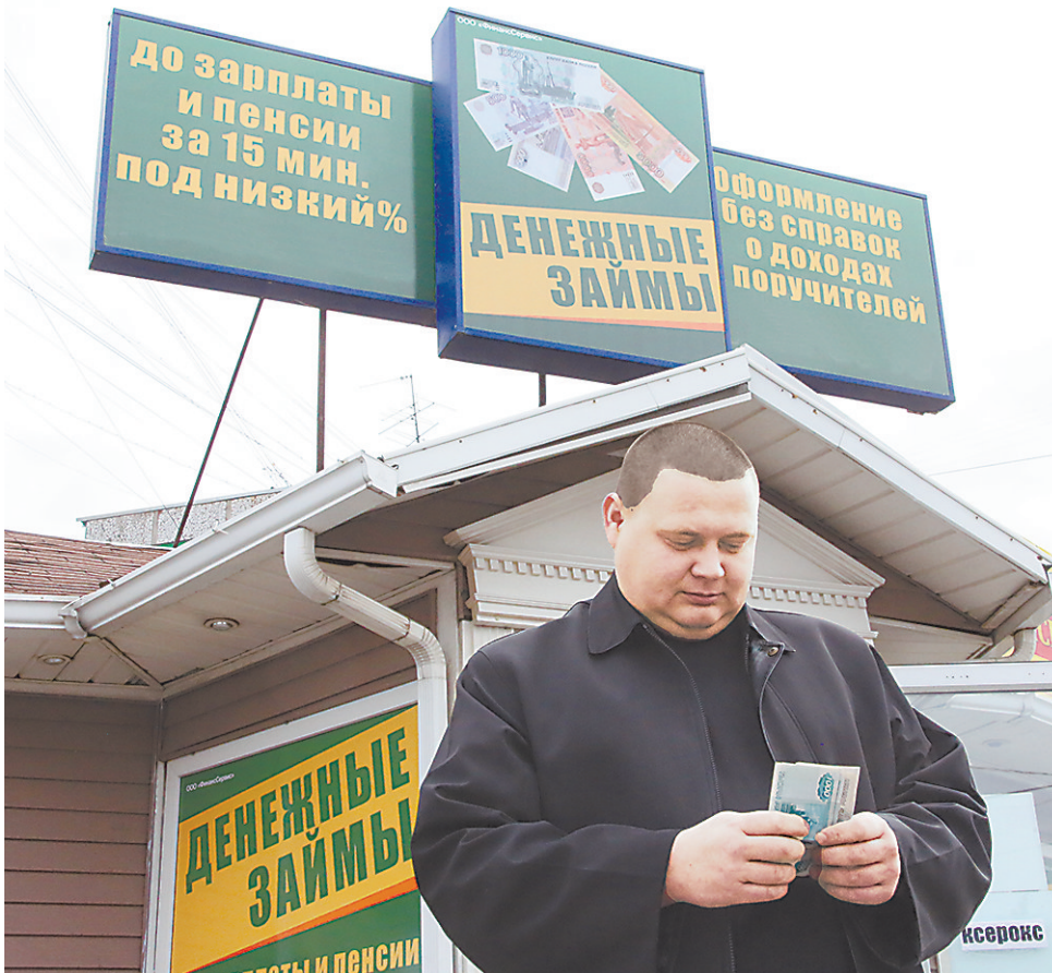
Беря деньги в долг, полагайтесь не на честность банкиров, а на собственные знания и внимательность.

В мировом суде Асбеста из десятка дел лишь одно решение вынесено в пользу заемщика, который представил все квитанции об оплате. А в качестве свидетеля выступил кассир, подтвердивший, что принимал у