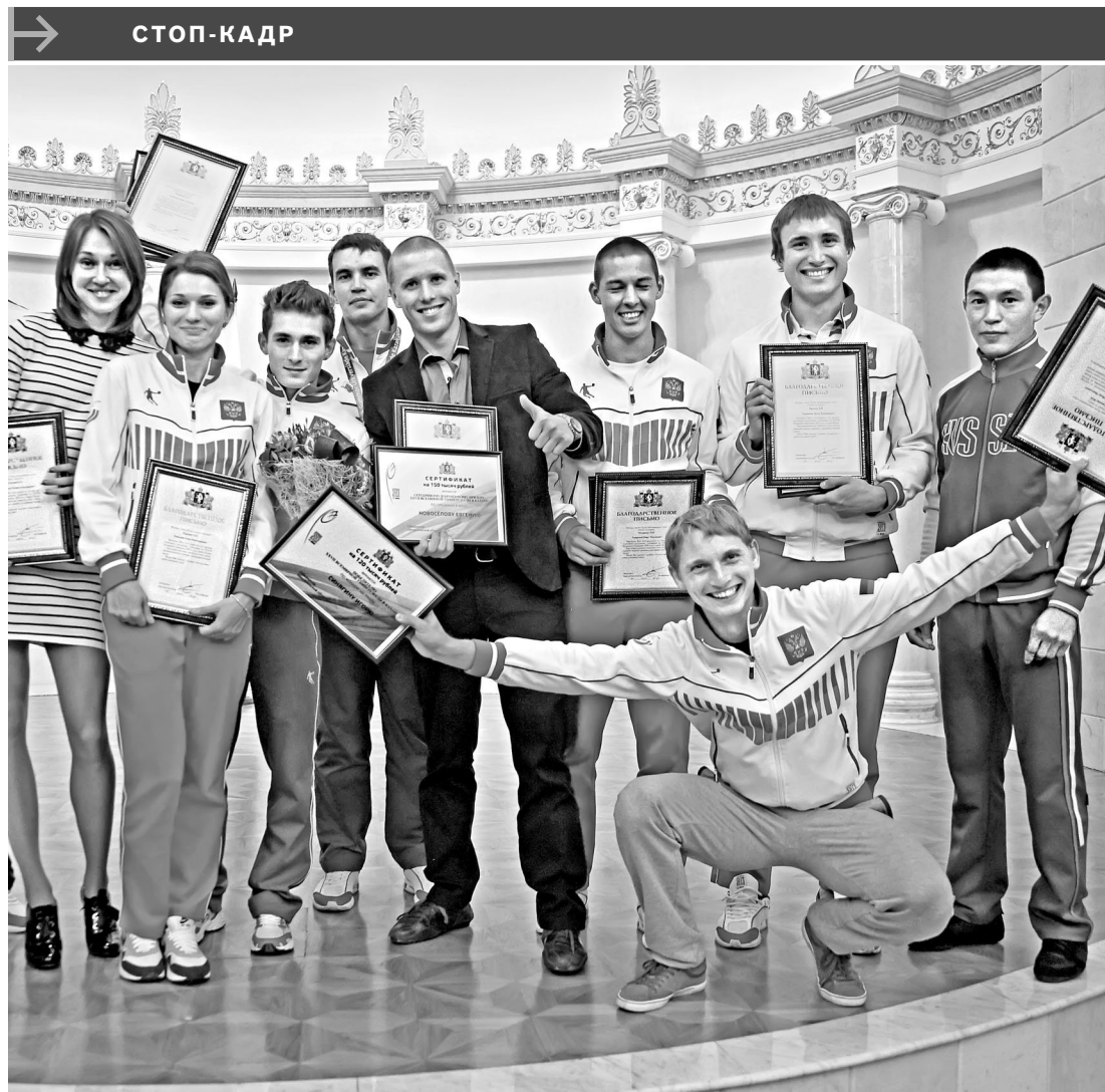
В Екатеринбурге чествовали призеров Всемирной универсиады в Казани. Уральские спортсмены стали сильнейшими во многих видах спорта — в легкой атлетике, спортивной гимнастике, плавании. Власти региона приняли решение поощрить обладателей золотых медалей 120 тысячами рублей, серебряных — 90 тысячами, а бронзовых — 60 тысячами.