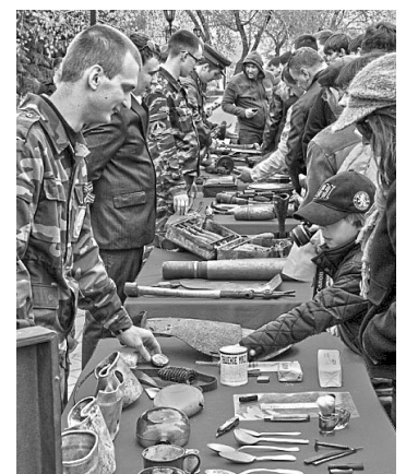
Экспозиция передвижного музея объехала всю Тюменскую область.