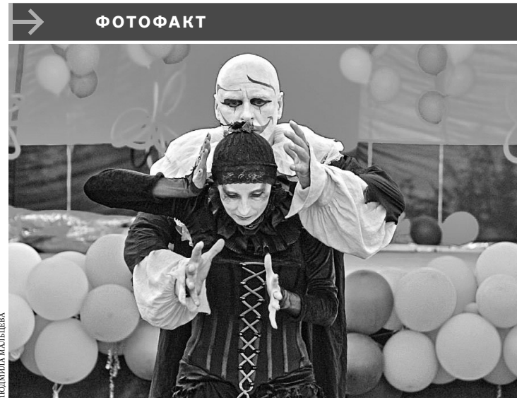
В Югре дает представления уличный театр белой клоунады «GiraffeRoyal» («Королевский жираф») из Эстонии. Артисты привезли в автономию некогда популярный, но уже подзабытый жанр площадных постановок.

Российская Газета самое время подписаться