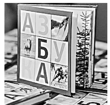
Челябинская азбука совсем маленькая: 10 на 10 сантиметров.