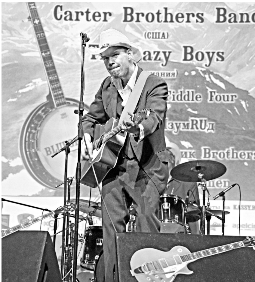
«The Lazy boys» играют в стиле, находящемся на границе кантри, рока и рок-н-ролла.

Кульминацией концерта стал выход «The Carter Brothers Band». Именно в их исполнении на Ура-