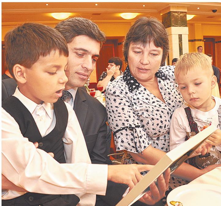
ДЕПАРТАМЕНТ ИМУЩЕСТВА ГОСУДАРСТВА СВЕРДЛОВСКОЙ ОБЛАСТИ

Первым опытом по освоению крупных территорий стала разработка земель в поселке Верхнее Дуброво. Нужно было отладить механизм создания практически в чистом поле подготовленных к застройке участков. В июле там получили землю 24 семьи.