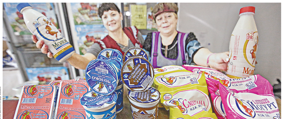
Продукция Ирбитского молочного завода пользуется неизменным спросом у покупателей.