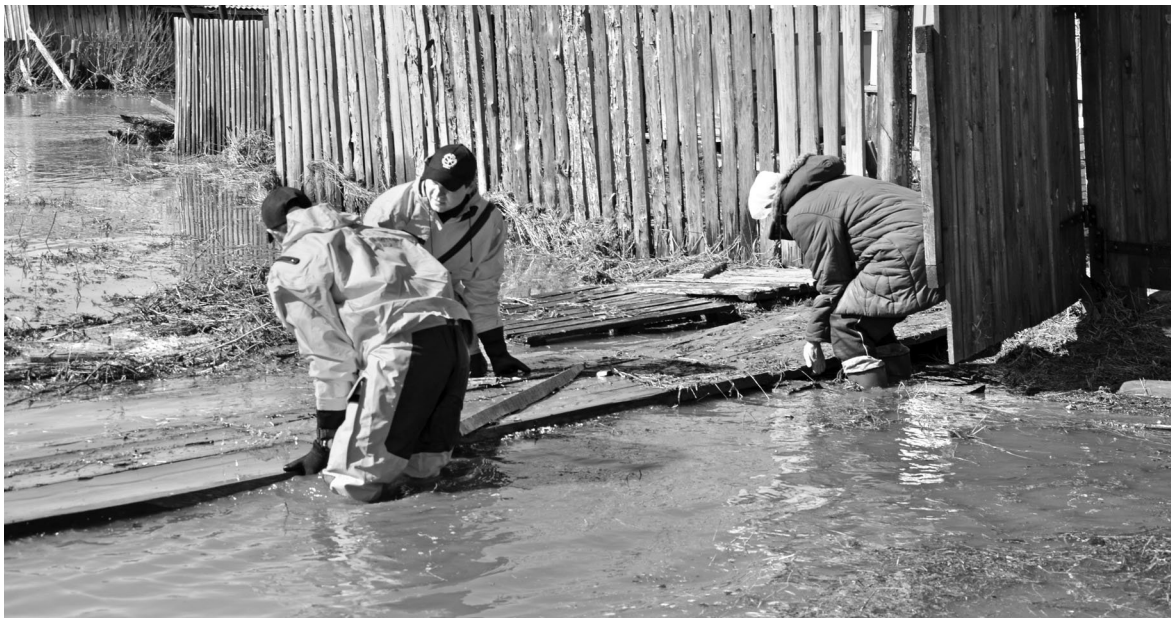
ГУ МЧС РОССИИ ПО СВЕРДЛОВСКОЙ ОБЛАСТИ

Из-за паводка на Среднем Урале эвакуируют жителей деревень