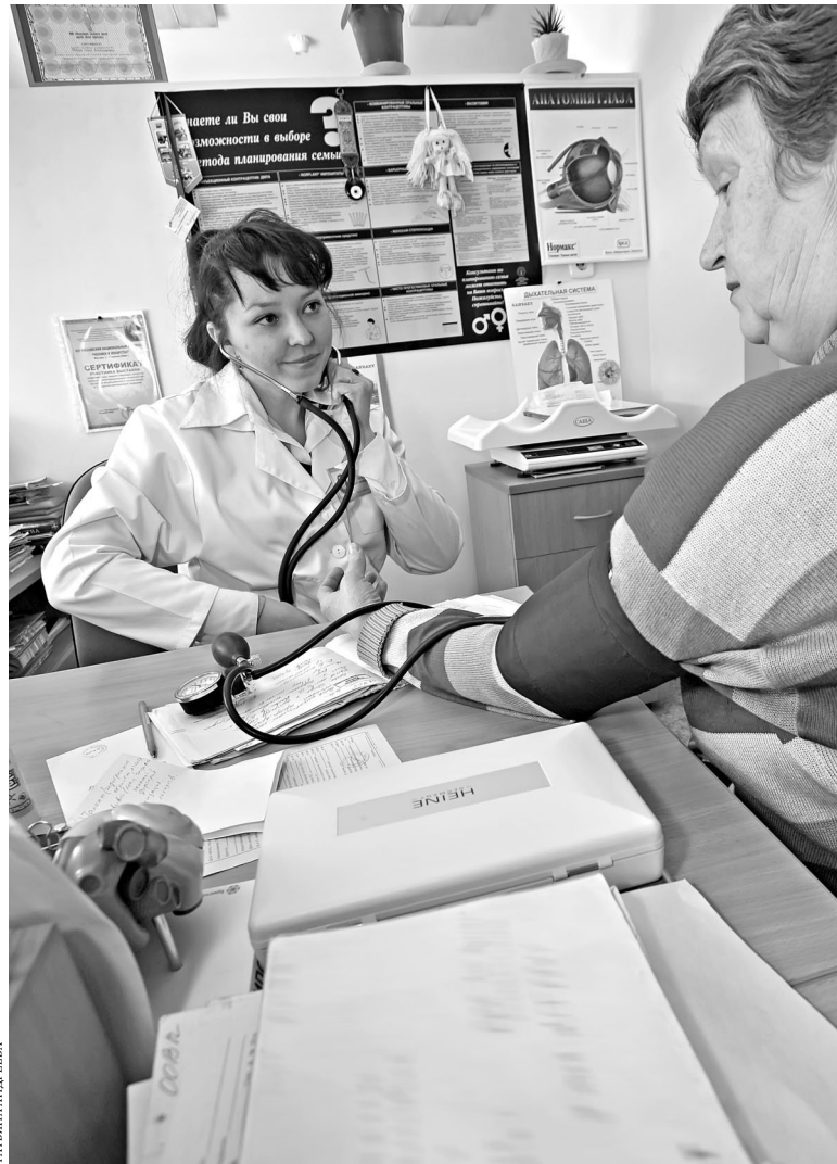
Жители села очень ценят возможность в любой момент посетить врача, даже если все специалисты принимают в одном кабинете.

Из красноуфимского села Русская Тавра омбудсмену прислали