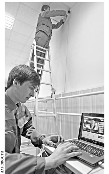
Запись с половины установленных в школах камер будет транслироваться на специальном сайте.