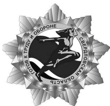
Региональный значок ГТО существует на Урале с 2011 года.

Предполагается, что собственный спортивный знак отличия проживет на Среднем Урале еще не менее года. А когда с осени 2015 года комплексы ГТО возродят по всей стране, «младший брат» уступит место старшему. Кстати, до сих пор неизвестно, как будет выглядеть общероссийский знак ГТО. На сайте федерального министерства физкультуры и спорта сейчас идет интернет-голосование за самый удачный эскиз. Свое мнение уже высказали более 18 тысяч человек.