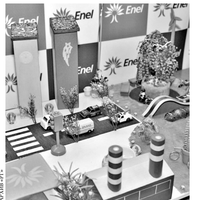
Ветряные мельницы и дома с солнечными батареями обязательно должны быть в городе будущего.