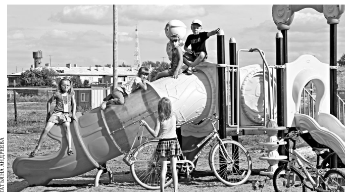
Изучение «Карты безопасного детства» поможет родителям выбирать для активного отдыха детей только проверенные на прочность конструкции.

Опасные для детей уличные объекты на сайте: безопасныйгород74.рф