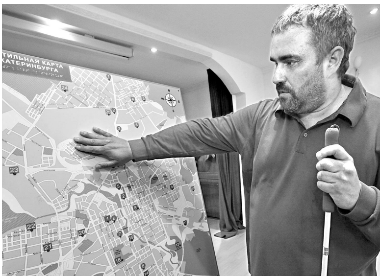
Названия улиц на карте легко читаются на ощупь, поскольку выполнены объемными буквами.

После успешной презентации областные власти выразили желание материально поддержать проект. По прогнозам общественников, к началу следующего года карты появятся на улицах и в общественных местах Екатеринбурга.