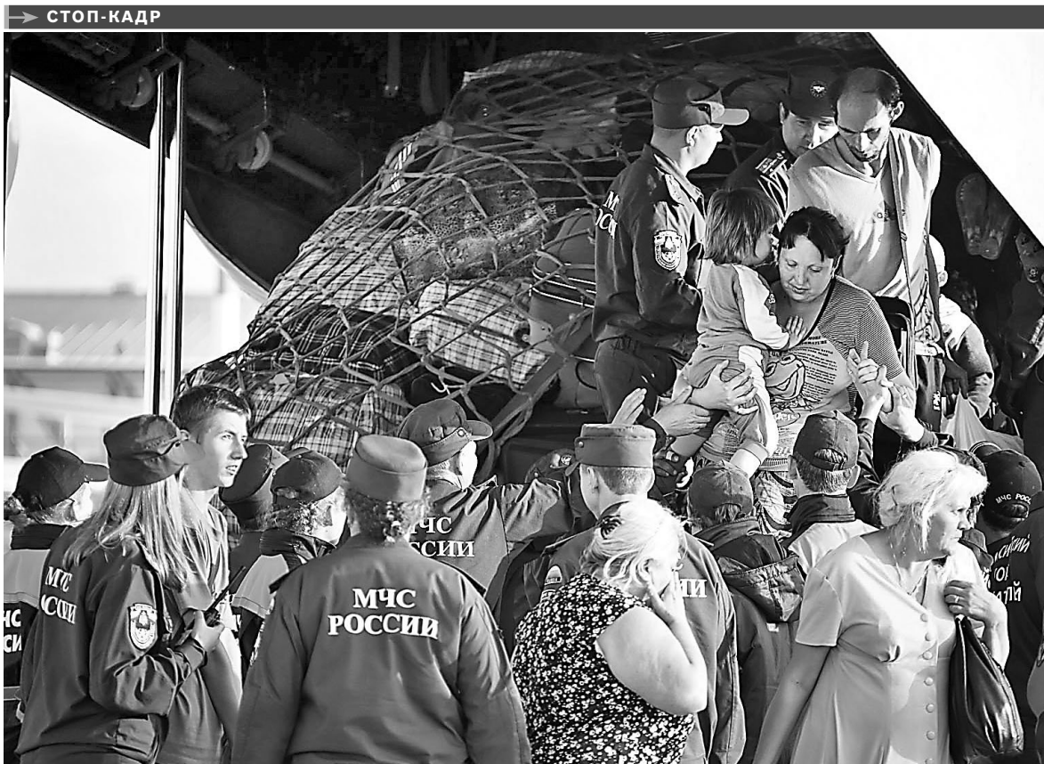
В Екатеринбург на самолете МЧС прилетели 112 вынужденных переселенцев с юго-востока Украины, среди них 33 ребенка, самому младшему из которых 11 месяцев. Еще около 40 человек доставили на Средний Урал поезда из Адлера и Анапы. Беженцы, прибывшие спецбортом МЧС, отправились в пункты временного размещения в Нижнем Тагиле, остальные — в Первоуральск и Березовский. По данным на 29 июля, власти Свердловской области помогли обустроиться в регионе 180 украинским беженцам.

В БЭБИ-БОКСЕ, установленном весной этого года в одном из храмов в центре Екатеринбурга, впервые сработала сигнализация, извещающая, что в «колыбель» положили ребенка. Сотрудники храма по инструкции вызвали скорую и полицию. Медики, осмотревшие малыша, сказали, что он здоров, на первый взгляд, ребенку 3—5 дней. Рыжеволосый мальчик был в памперсе, тепло одет и закутан в плед. Никаких записок при подкидыше не было.