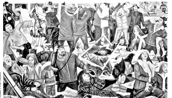
На картине изображены реальные люди, очевидцы падения метеорита.