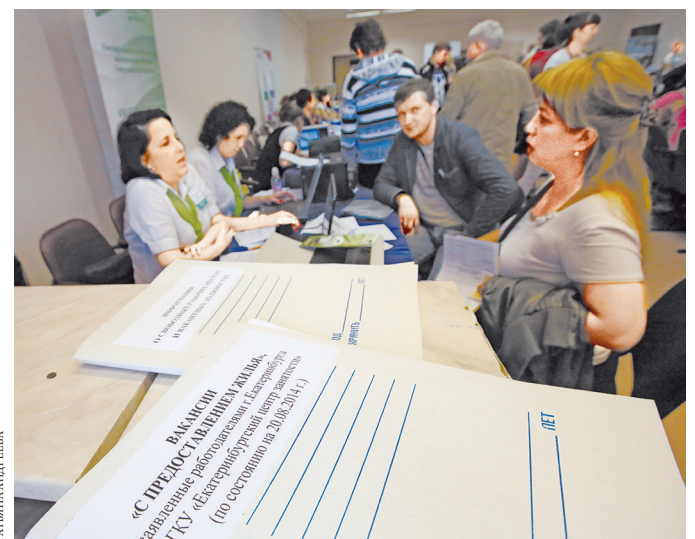
Две трети работодателей предоставляют места для проживания, а также компенсируют аренду жилья.