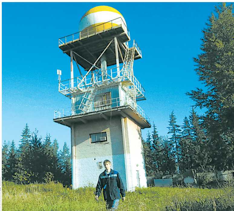
Единственный на весь Урал метеолокатор установлен на территории аэропорта Кольцово, под Екатеринбургом.