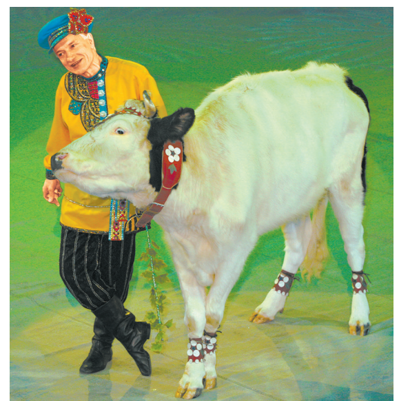
На арене цирка буренки исполняют народные танцы.