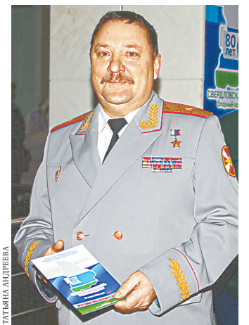
Генерал-майор Роман Шадрин возглавил объединение уральцев-героев.