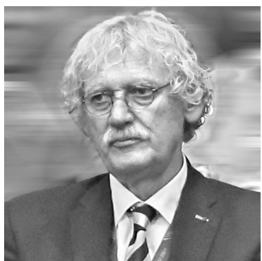
Грустно Жан-Люку Руже: Поведение спортсменов неприемлемо, и я осуждаю этот поступок.

Президент федерации дзюдо Франции Жан-Люк Руже принес извинения за пикантный инцидент, который произошел в Челябинске: французские дзюдоисты перед отъездом