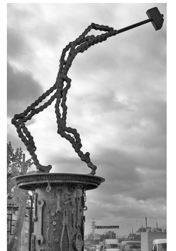
Авангардистские творения пришлись по душе молодым челябинцам.