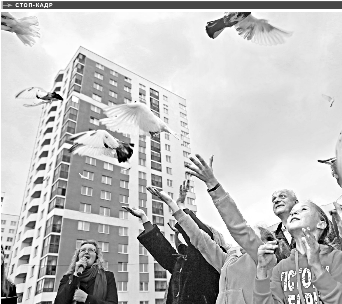
Самому молодому району Екатеринбурга Академическому исполнилось пять лет. В честь этой даты жители организовали праздничное шествие и концерт, а также выпустили в небо белых голубей. В завершение торжества юные спортсмены соревновались в гонках на велосипедах и самокатах. Сейчас в Академическом обосновалось почти 40 тысяч человек.

1 ОКТЯБРЯ у будущих хоккеистов прошла первая тренировка. В школу записалось около 70 человек—это три полноценные группы. Сегодня в Екатеринбурге подготовкой хоккеистов занимаются две специализированные ДЮСШ—«Юность» и «Спартак». Но для мегаполиса этого явно недостаточно. Новая детская школа обосновалась под крылом профессионального клуба, члена КХЛ, который намерен делать ставку на воспитание собственных хоккеистов.