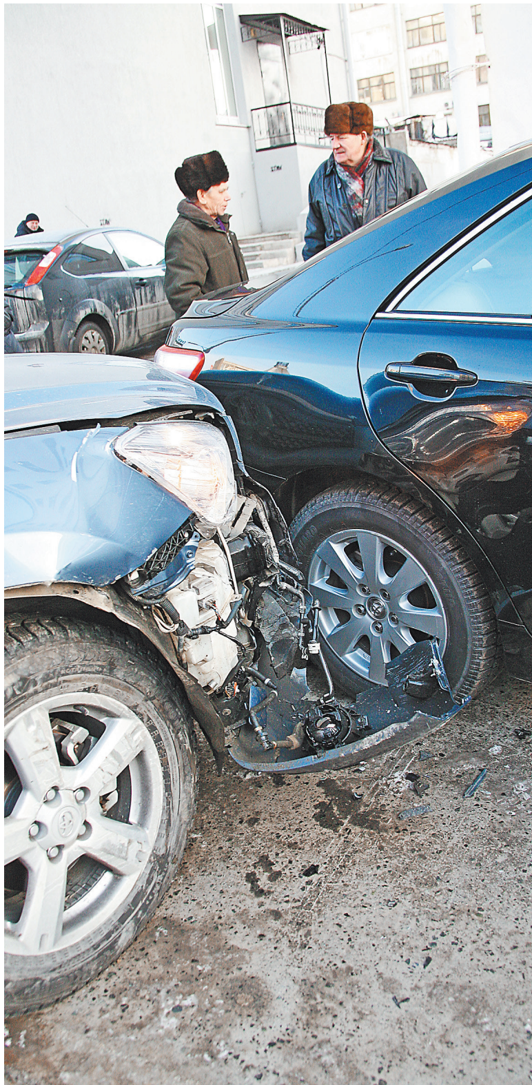
С 1 октября максимальная сумма компенсации ущерба за каждый пострадавший в ДТП автомобиль составляет 400 тысяч рублей.

Новых бланков полисов ОСАГО пока нет. Причина — в спешке как всегда забыли принять подзаконные акты, в том числе правитель-