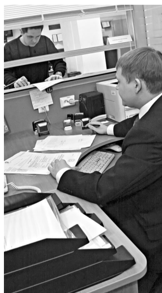
27 октября работники налоговых инспекций выслушают все жалобы посетителей.