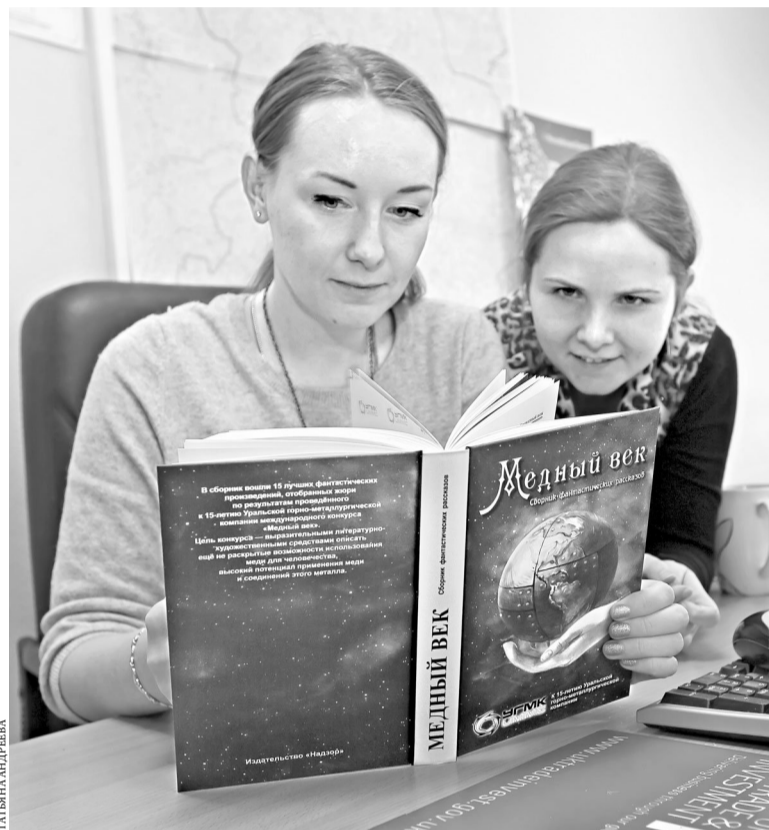
Тема меди, заявленная в сборнике, помогла писателям решать общечеловеческие проблемы.

Кроме литературного дара конкурсанты должны были обладать серьезными познаниями в естественных науках, ведь по условиям состязания все произведения обязаны иметь реальную научную основу.