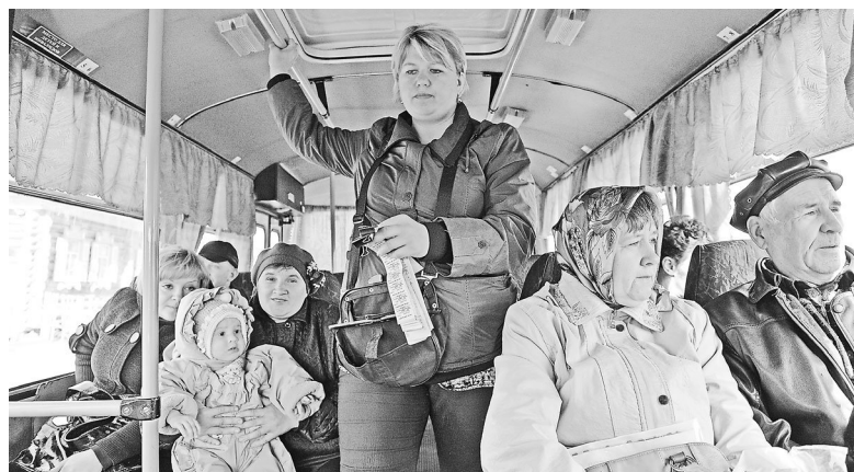
Льготники Екатеринбурга могут быть спокойны: для них стоимость проезда пока осталась прежней.

О намерении поднять цену проездных и разовых билетов для пен-