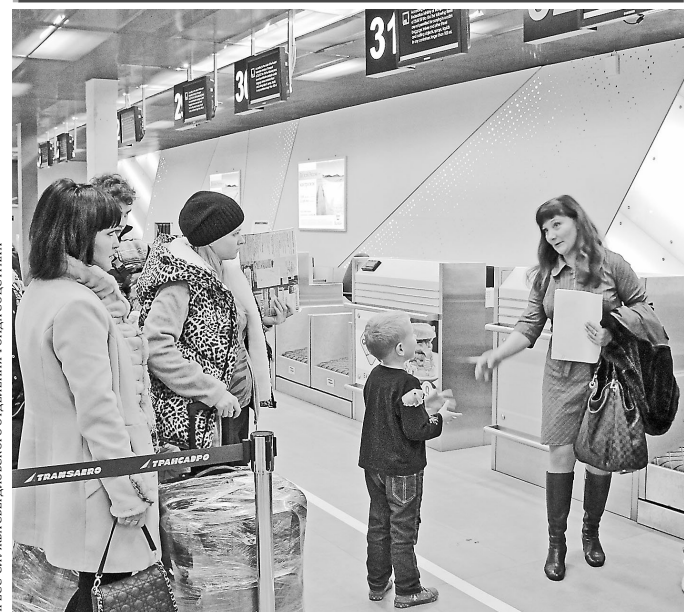
ПРЕСС-СЛУЖБА СВЕРДЛОВСКОГО ОТДЕЛЕНИЯ ФОНДА СОЦИАЛЬНОГО СТРАХОВАНИЯ

29 октября Свердловское региональное отделение Фонда социального страхования РФ отправило первую группу детей-инвалидов в санатории Крыма. Для юных пассажиров были созданы максимально комфортные условия, начиная от приезда в аэропорт и заканчивая посадкой в самолет. До конца года за счет средств соцстраха в Крыму смогут оздоровиться более 5,6 тысячи жителей Свердловской области.