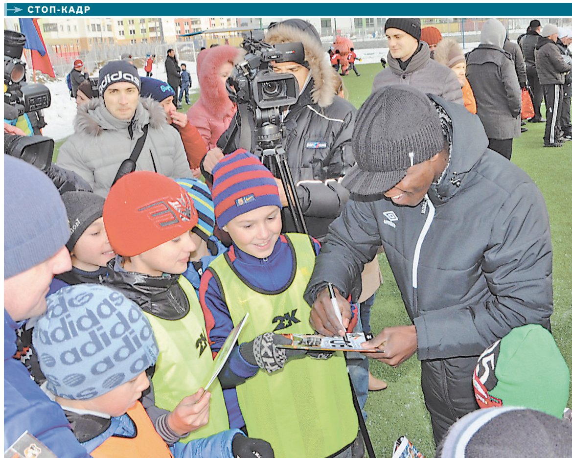
В День народного единства в Академическом районе Екатеринбурга прошел футбольный матч между командами местных школ и спорткомплекса «Юность». Мастерство начинающих спортсменов оценили профессионалы из клуба «Урал». Они провели для юных коллег мастер-класс и раздали автографы.

ПОЛЕТЫ будут выполняться на небольших чешских самолетах, вмещающих до 19 пассажиров, три раза в неделю—по вторникам, четвергам и воскресеньям. Время в пути—два часа. Минимальная цена билета в одну сторону—3625 рублей, не считая кассовых сборов. Новый рейс станет выгодной альтернативой поездке по железной дороге: стоимость авиaperелета незначительно отличается от цены билета на поезд.