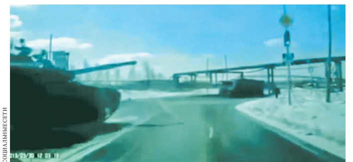
На видеозаписи с автомобильного регистратора видно, как легковушку подрезает танк, выезжающий с восторостепенной дороги.