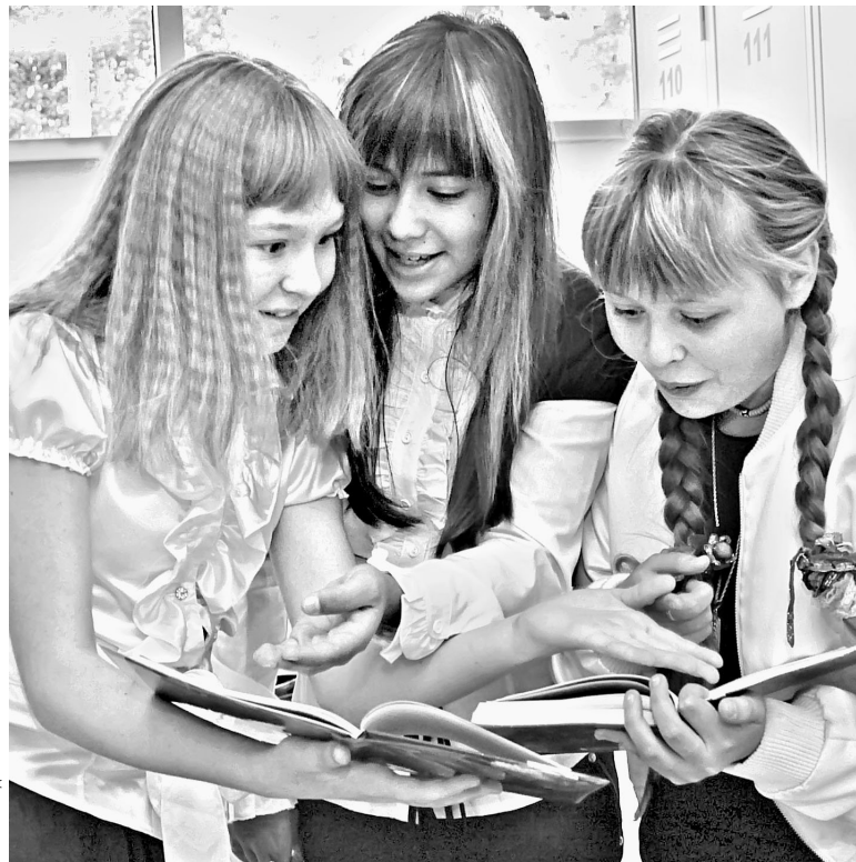
По мнению библиотечкарей, дети не утратили интерес к книге.