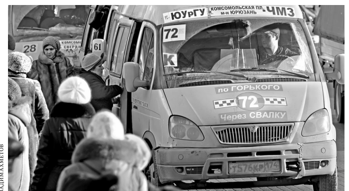
Челябинцы считают, что властям лучше взяться за автоперевозчиков, а не выкручивать руки пассажирам, требуя предъявить проездной билет.