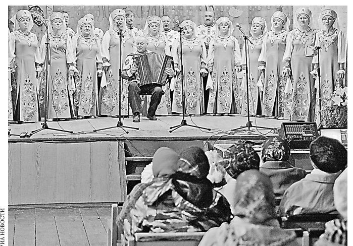
Власти обещают, что модульные ДК появятся прежде всего в тех деревнях, где кипит культурная жизнь.