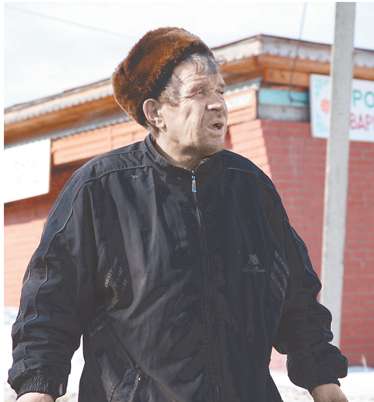
Пьяный в деревне — обычная картина.

Большое дело, по ее словам, сделал запрет на продажу алкоголя в ночное время. Продавцы не рискну-