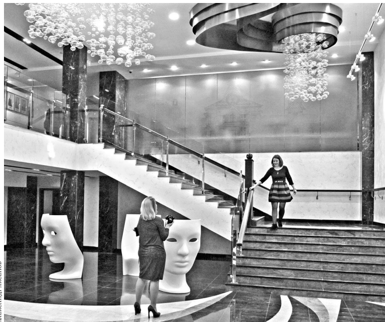
В реконструкцию театра вложено свыше 500 миллионов рублей.

Помещения театра ненавязчиво напоминают о его богатой истории. В кафе на потолке размещены фотографии роскошного терема, выстроенного для театра в 1899 году. Через 90 лет пожар уничтожил выдающийся памятник деревянного зодчества. На полу в фойе — огромный «автограф» Петра Ершова, чье имя носит труппа. Оставил свои воспоминания о театре, обретшем первый постоянный дом в 1794-м, Александр Радищев. А первые представления в столице Сибири были даны в 1705 году у стен Архирейского дома—по инициативе митрополита Филофея Лещинского.