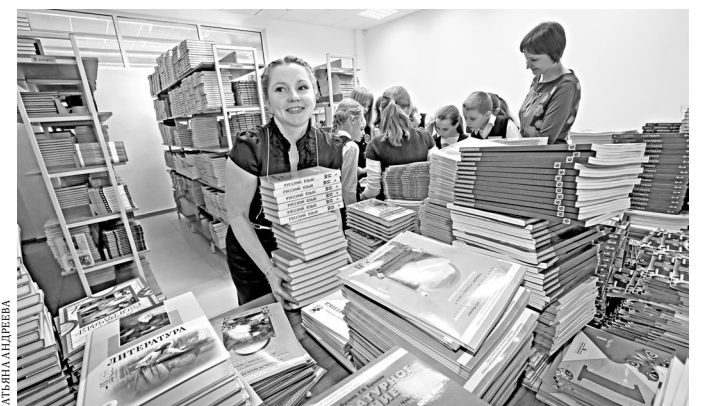
Сотрудникам школьной библиотеки сейчас хватает работы—книжный фонд увеличился в несколько раз.