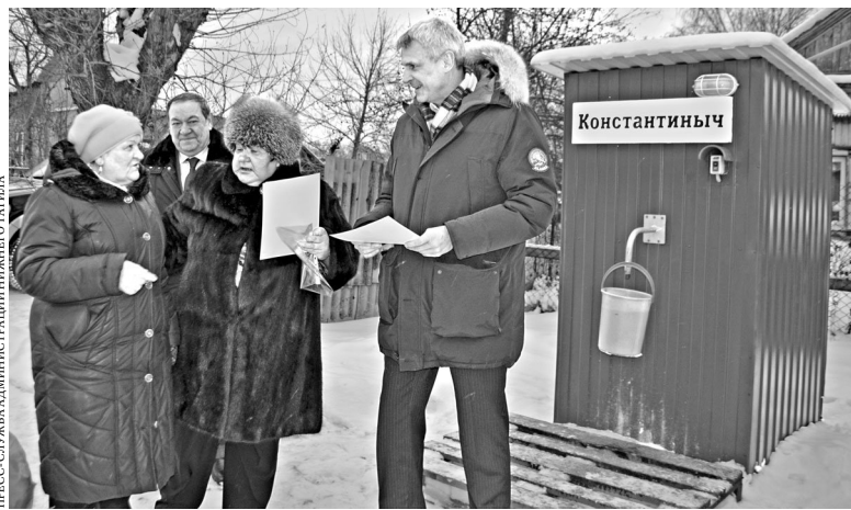
«Константиныч» построен на средства городского внебюджетного фонда.

Впрочем, жители Малой Кушвы считают: сделанное — лишь малый шаг к реальному благоустройству территории. Они еще надеются, что к их домам все-таки проложат водопровод и канализацию. Проект уже почти готов, но цену вопроса и сроки власти не торопятся оглашать.