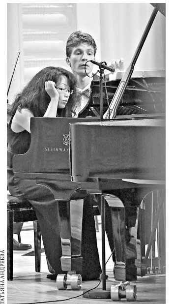
Игра в четыре руки понравилась и музыкантам, и зрителям.